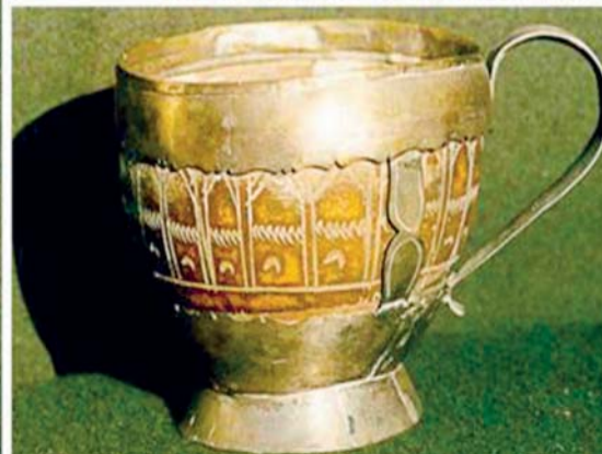
ALGUNAS PIEZAS PROVIENEN EN SU MAYORÍA DE LA CULTURA TIWANAKOTA, SIENDO SU ESCENARIO DE DESARROLLO LA REGIÓN ALTIPLÁNICA DEL PAÍS.