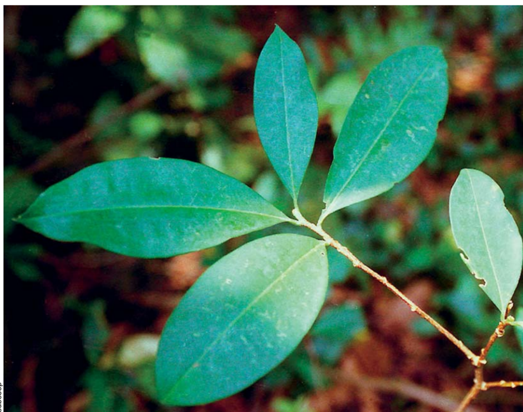
LA PRODUCCIÓN DE LA COCA ILEGAL SE EXPANDE TAMBIÉN A LAS ÁREAS PROTEGIDAS DEL PAÍS.

Por otro lado, Antonino de Leo informó que en 2015, seis de las 22 áreas protegidas del país, han sido afectadas con cultivos de hoja de coca ilegal, cuya producción es destinada al narcotráfico.