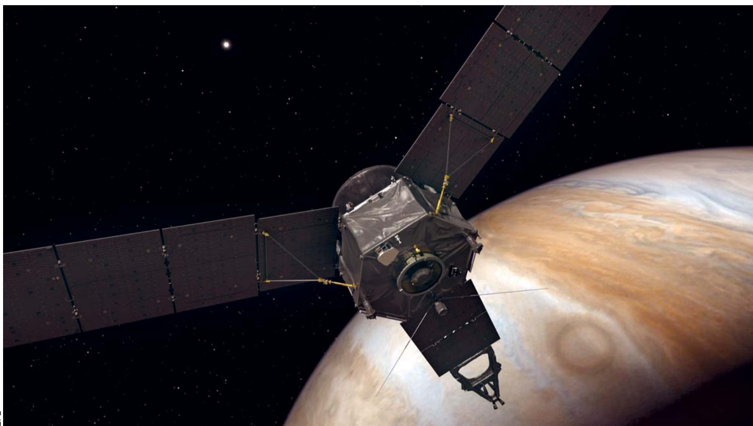
LA NAVE, LANZADA HACE CASI CINCO AÑOS, FUE EQUIPADA CON NUEVE INSTRUMENTOS CIENTÍFICOS QUE DEBERÍAN SERVIR PARA ACLARAR LOS ENIGMAS, PERO AL MISMO TIEMPO JÚPITER, CON SU RADIACIÓN EXTREMA Y OTROS PELIGROS DESCONOCIDOS, NO VA A PONER LAS COSAS FÁCILES.