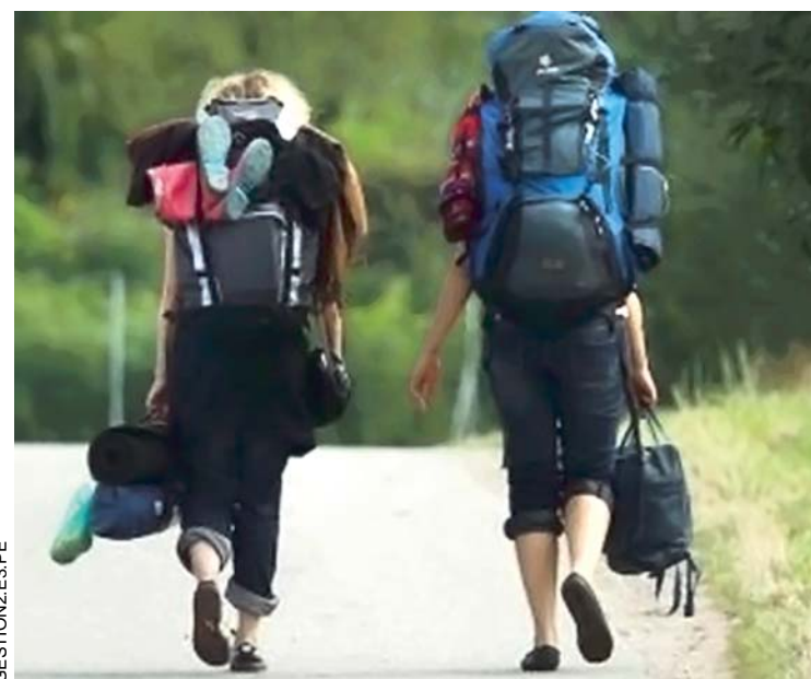
LOS MOCHILEROS SE HAN CONVERTIDO EN EL PRIMER ESLABÓN DEL TRANSPORTE DE DROGA EN PERÚ.

En 2015, la Felcn registró más de 8 toneladas confiscadas en distintos operativos, que equivale a la cifra más alta de incautación de clorhidrato de cocaína en los últimos 10 años.