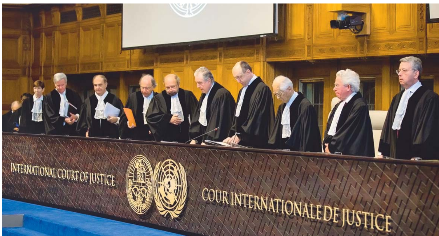
MIEMBROS DEL TRIBUNAL INTERNACIONAL DE JUSTICIA (CIJ) DE LA HAYA.

• El Tribunal Internacional de Justicia (CIJ) registró a la demanda interpuesta por Chile contra Bolivia, por el uso de las aguas de los manantiales del Silala, como una disputa de agua y no de un río, informó el agente boliviano Eduardo Rodríguez Veltzé. La delegación chilena que debía llegar el 15 de julio a la región del Silala decidió suspender su visita