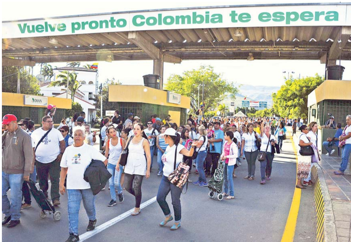
MILES DE CIUDADANOS VENEZOLANOS ACUDIERON DESDE TEMPRANAS HORAS AL LÍMITE FRONTERIZO, BAJO LA ORGANIZACIÓN DE LA GUARDIA NACIONAL BOLIVARIANA (GNB), CON LA FINALIDAD DE CRUZAR EL MENCIONADO PUENTE PARA ABASTECERSE DE PRODUCTOS DE PRIMERA NECESIDAD EN COLOMBIA.

Desde las 6.00 de la mañana se dio la apertura parcial de la frontera para el paso peatonal en San Antonio del Táchira, municipio Bolívar. "¡Gracias a Dios!",