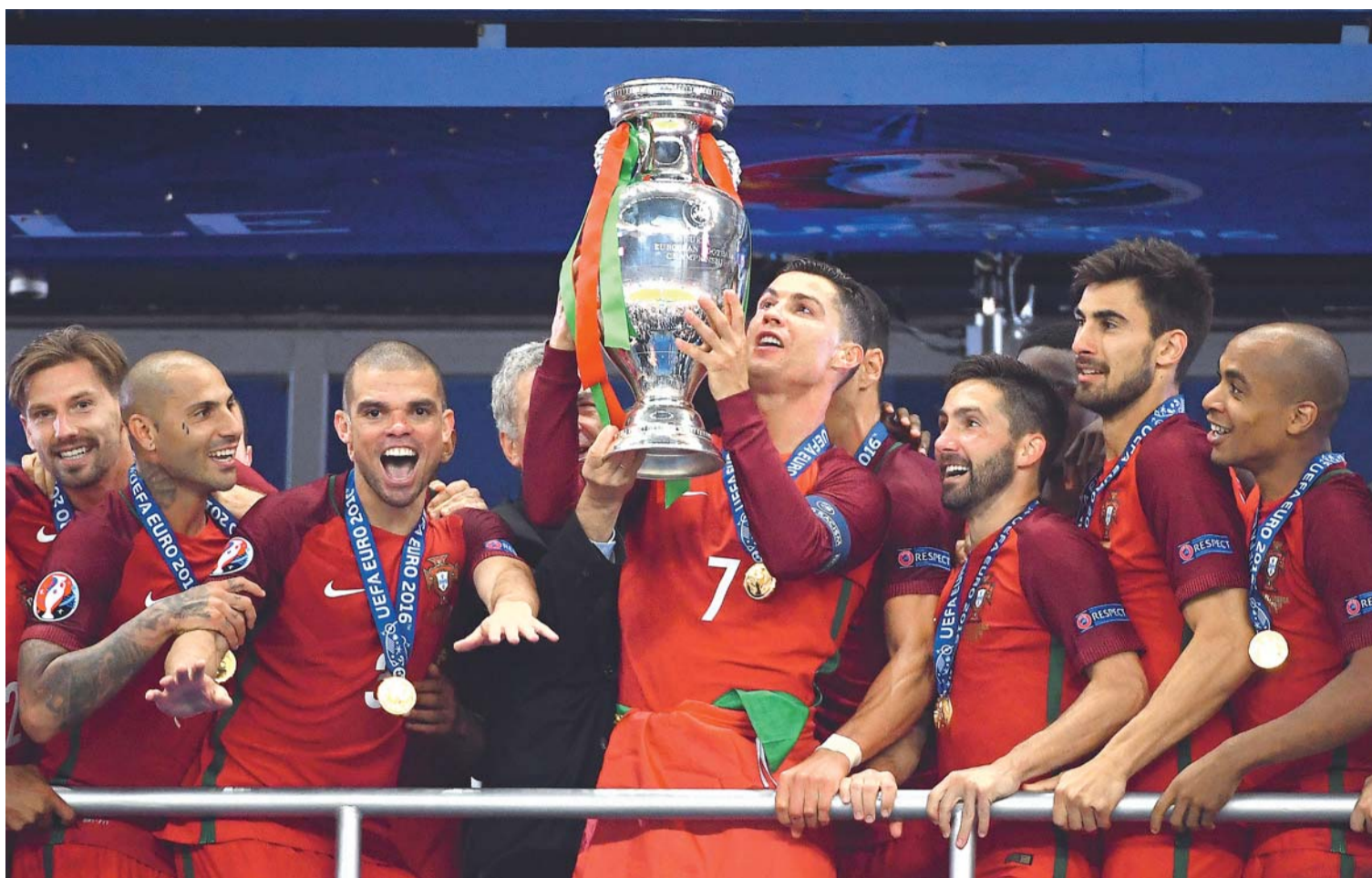
EL CAPITÁN CRISTIANO RONALDO (7) LEVANTA LA COPA COMO CAMPEÓN DE LA EUROCOPIA 2016. PORTUGAL SE IMPUSO EN UN COTEJO ELECTRIZANTE A FRANCIA POR 1-0.

Cristiano Ronaldo vive una pesadilla que ya experimentó hace varios años en una final de Eurocopa y volvió a llorar.