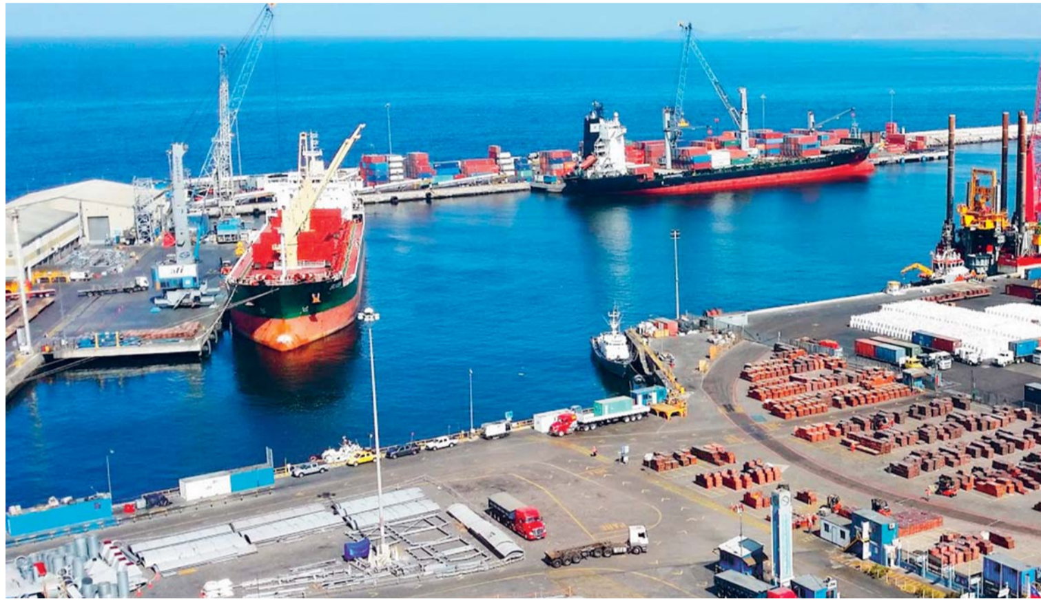
LOS PUERTOS CHILENOS RECIBEN BUENOS INGRESOS POR LA CARGA INTERNACIONAL BOLIVIANA. LA EXPORTACIÓN Y LA IMPORTACIÓN GENERAN UN MOVIMIENTO ECONÓMICO IMPORTANTE PARA ESA REGIÓN.