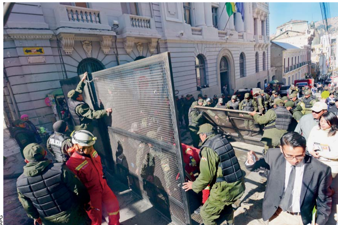
EFFECTIVOS POLICIALES QUITAN LAS MALLAS QUE RESGUARDABAN LA PLAZA MURILLO POR LOS CONFLICTOS DE DISCAPACITADOS. LOS VEHÍCULOS Y PEATONES VUELVEN A CIRCULAR POR ESE SECTOR.

Después de 77 días de cierre del punto principal del país, el Gobierno ordenó retirar las vallas de seguridad de las calles adyacentes de la plaza Murillo. Los efectivos policiales levantaron el cerco y las vías quedaron expeditas por las fiestas julias.