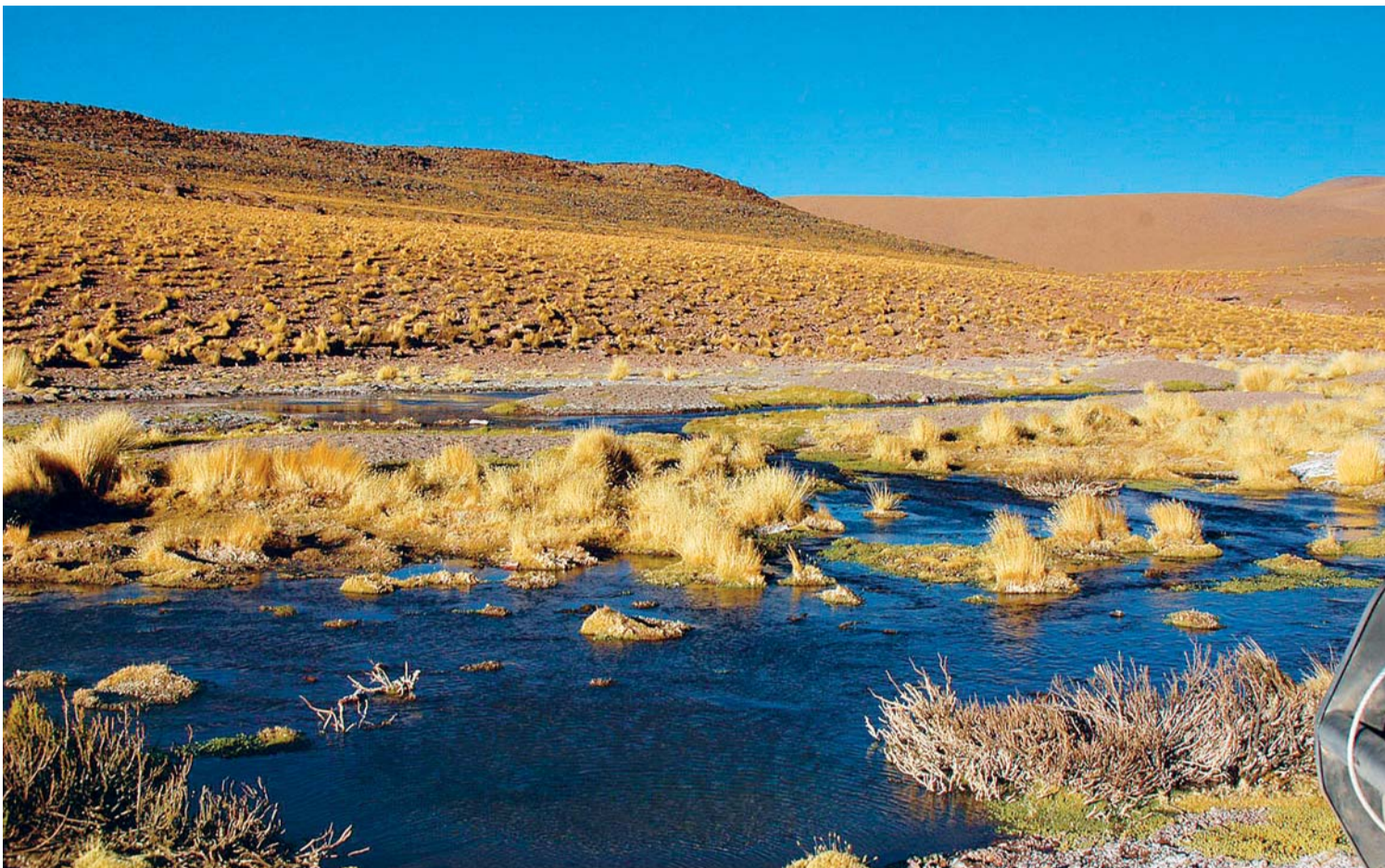
LAS AGUAS DEL MANANTIAL DEL SILALA, NACIDAS EN EL SUROESTE POTOSINO DEL TERRITORIO BOLIVIANO, CERCA DE LA FRONTERA CON CHILE, FLUYEN HACIA ESE PAÍS SIN QUE MEDIE RETRIBUCIÓN ALGUNA.