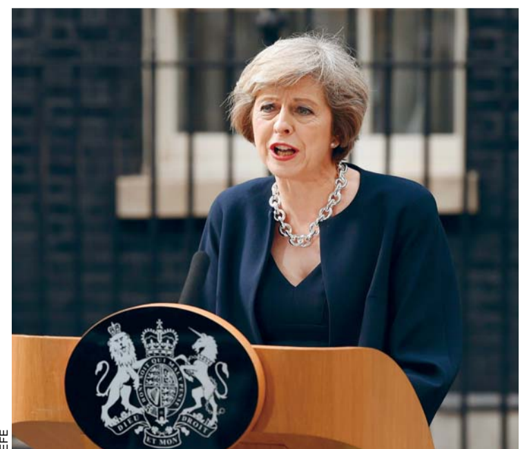
LA PRIMERA MINISTRA THERESA MAY PROMETIÓ MANTENER LA UNIDAD DE SU PAÍS.