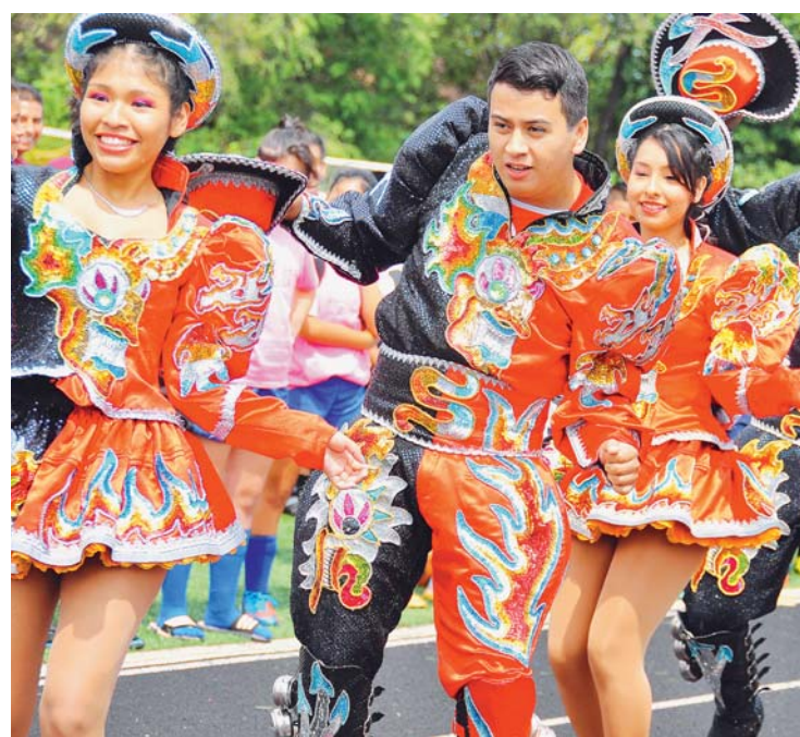
LOS CAPORALES REPRESENTARÁN AL PAÍS EN MÉXICO.

Una delegación de artistas representará a Bolivia en las Olimpiadas Mundiales de Folklore denominada "Folkloriada 2016", después de 20 años, las que se desarrollarán en México del 30 de julio al 15 de agosto.