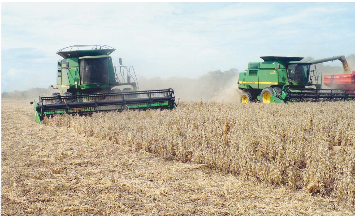
EN GESTIONES ANTERIORES LA AGRICULTURA CONTRIBUYÓ CON CERCA DE 12 POR CIENTO EN EL PRODUCTO ECONÓMICO DE 2014 Y GENERA CASI 80 POR CIENTO DEL EMPLEO RURAL. SIN EMBARGO, EN LA ACTUALIDAD, LOS PRODUCTORES ENFRENTAN UNA DIFÍCIL SITUACIÓN DEBIDO A LA SEQUÍA.