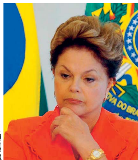
DILMA ROUSSEFF ANTE JUICIO POLÍTICO.