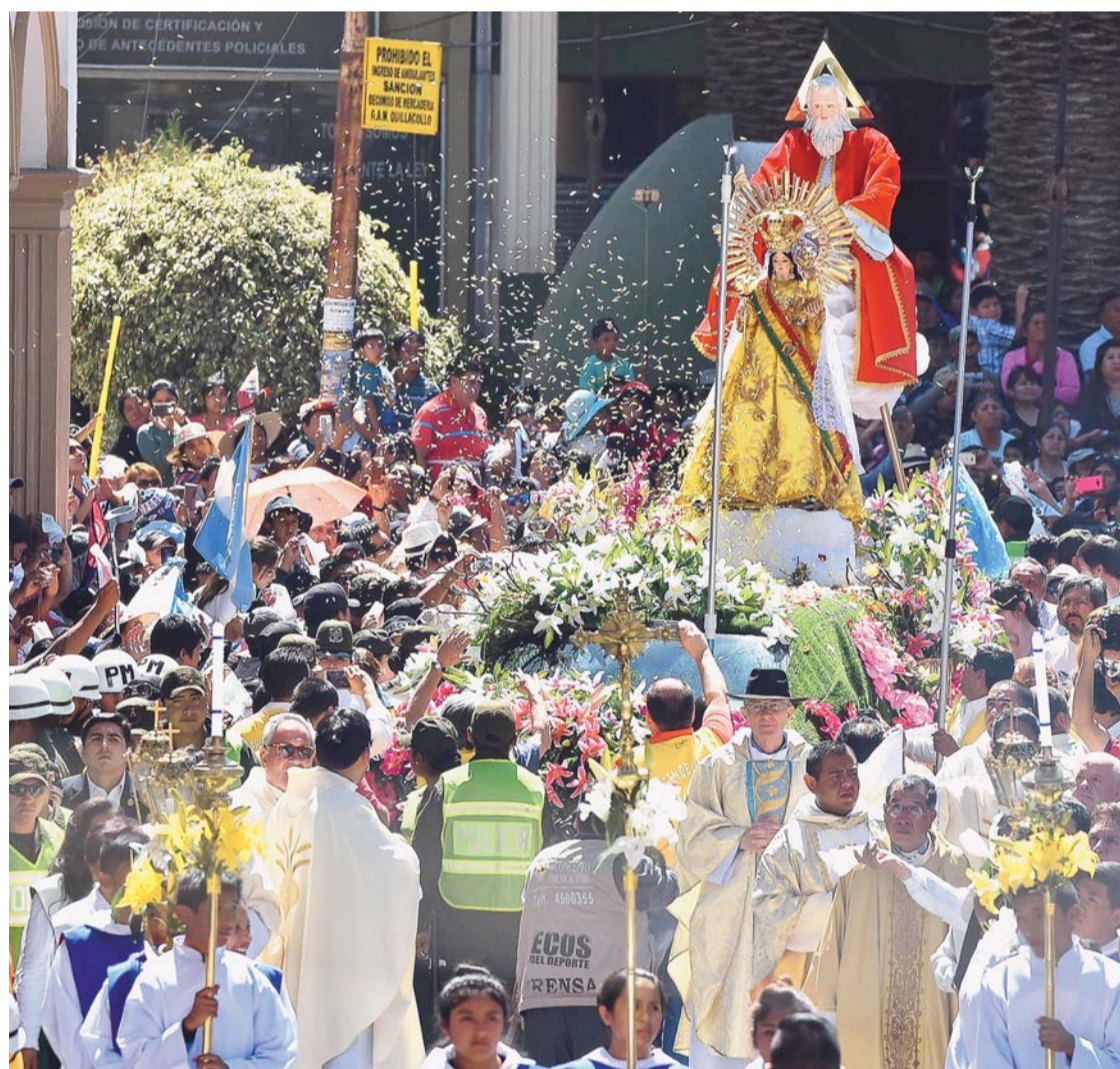
MILES DE PEREGRINOS DEMOSTRARON SU FE RELIGIOSA A LA VIRGEN DE URKUPIÑA EN EL TEMPLO DE SAN ILDEFONSO.

Miles de fieles de diferentes lugares del país se trasladaron hasta el cerro Cota para cumplir con la promesa a la Virgen y participar de las actividades religiosas y costumbristas de la Festividad de Urkupiña.