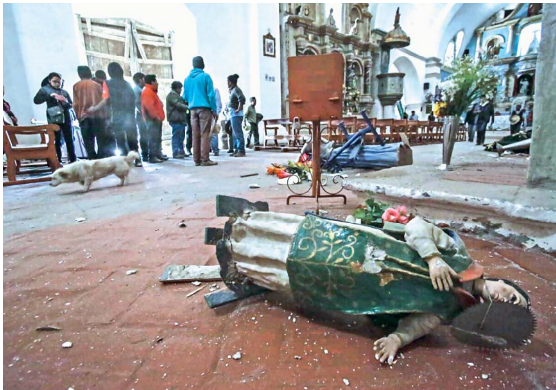
UNAS 648 VIVIENDAS QUEDARON INHABITABLES EN CAYLLOMA Y TRES IGLESIAS FUERON AFECTADAS.