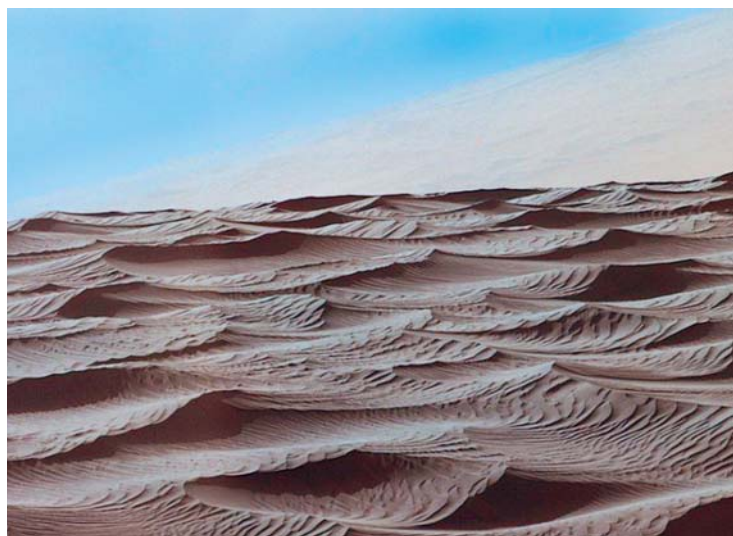
Dunas y cráteres de Marte