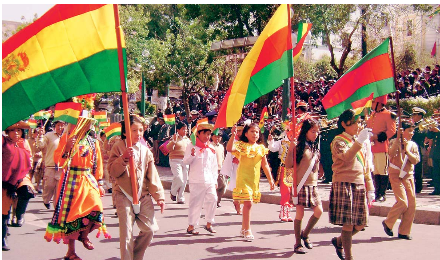
Día de la Bandera boliviana

CADA 17 DE AGOSTO SE CONMEMORA EL DÍA DE LA BANDERA EN CUMPLIMIENTO AL DECRETO SUPREMO DEL 30 DE JULIO DE 1924, LA TRICOLOR A MUCHOS INSPIRA UN SENTIMIENTO DE CIVISMO, ORGULLO Y RESPETO.