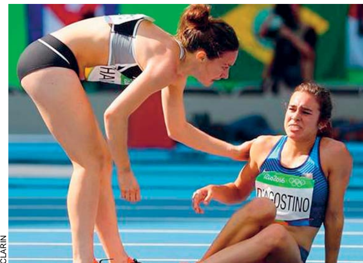
El gesto que emociona

ENTRE LA ARENISCA ROJA QUE DOMINA EL PAISAJE DE MARTE SE ESCONDEN OTRAS TONALIDADES QUE POCO A POCO VAN DESCUBRIENDO LAS SONDAS ESPACIALES. EN ESTA SELECCIÓN DE MÁS DE 1.000 IMÁGENES PUBLICADAS RECIENTEMENTE POR LA NASA, SE PUEDE APRECIAR ALGUNOS DE LOS HERMOSOS PAISAJES DEL "PLANETA ROJO" (QUE EN LAS MISMAS SE VE MÁS BIEN AZUL).