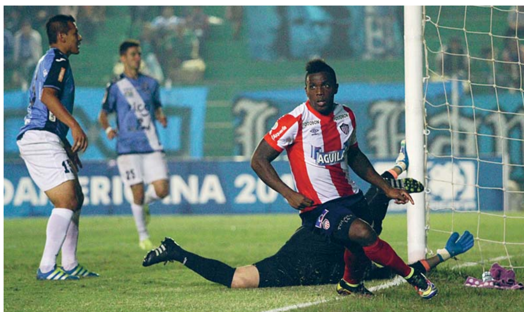
JUNIOR DE COLOMBIA VENCió A BLOOMING POR DOS TANTOS CONTRA CERO EN EL ESTADIO RAMÓN AGUILERA COSTAS.

Los estrenos de la semana: “La última ola”, película basada en un incidente con un tsunami que destruyó el pueblo de Tafford, Noruega, en abril de 1934, matando a 40 personas.