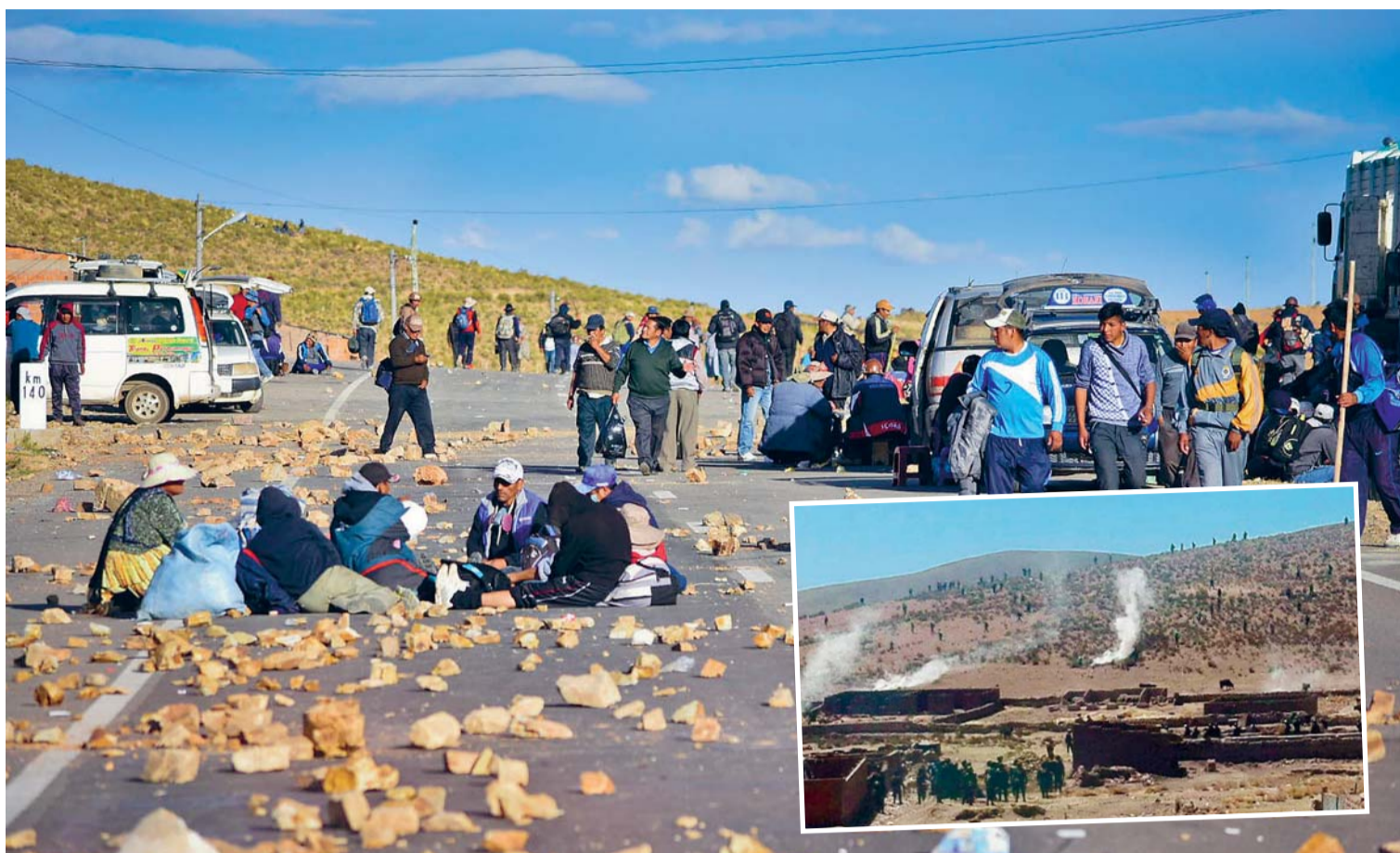
LOS COOPERATIVISTAS MINEROS PARALIZARON NUEVAMENTE CON SUS MOVILIZACIONES LA PAZ, URURO, COCHABAMBA Y POTOSÍ. LAS TERMINALES EN LOS MENCIONADOS DEPARTAMENTOS NO ATENDIERON LAS DEMANDAS DE LOS PASAJEROS, ALGUNOS DE ELLOS SE ARRIESGARON PARA LLEGAR A SUS DESTINOS MEDIANTE TRANSBORDOS.