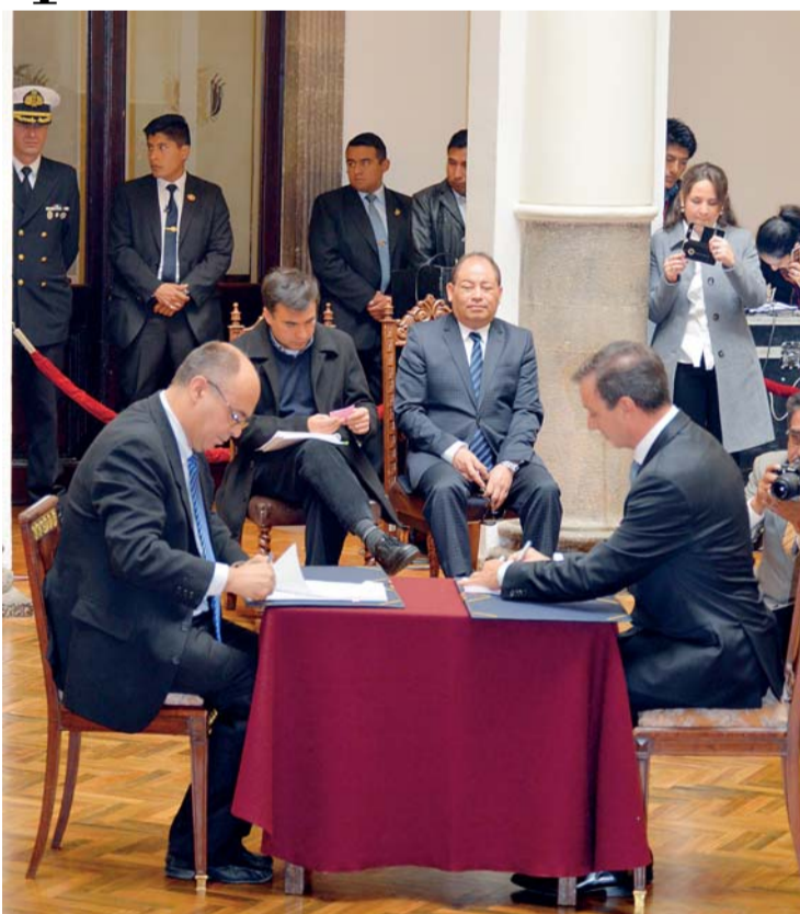
BOLIVIA Y FRANCIA SUSCRIBIERON EL CONTRATO PARA IMPLEMENTAR EL SISTEMA INTEGRADO DE DEFENSA AÉREA Y CONTROL DE TRÁNSITO AÉREO.

Un contrato para la instalación de 13 radares en el país fue suscrito ayer entre el Ministerio de Defensa y la empresa francesa “Thales Air Systems” por 191 millones de euros. El acuerdo permitirá implementar el Sistema Integrado de Defensa Aérea y Control de Tránsito Aéreo (Sidacta).