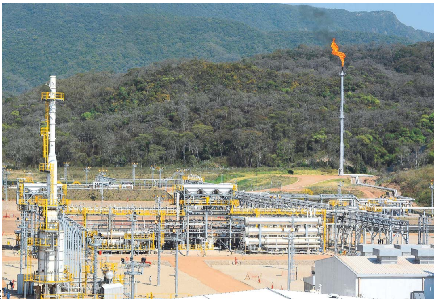
INCAHUASI POSEE RESERVAS DE 2 BILLONES DE PIES CÚBICOS DE GAS NATURAL. TOTAL TIENE UNA PARTICIPACIÓN DEL 50%, GAZPROM UN 20%, LA ARGENTINA TECPETROL 20%, Y LA PETROLERA ESTATAL BOLIVIANA YPFB EL RESTANTE 10 POR CIENTO.