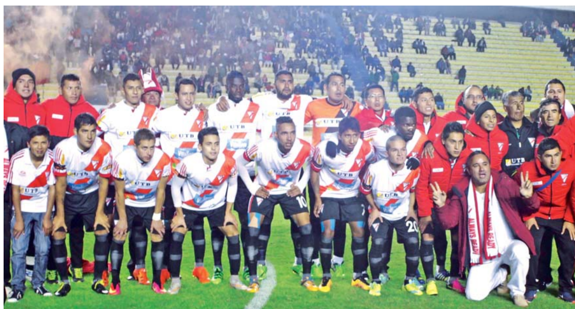
EL ENCUENTRO ENTRE ALWAYS READY Y AURORA SE JUGÓ EN EL ESTADIO HERNANDO SILES, DE LA PAZ, DONDE MÁS DE 4 MIL PERSONAS CELEBRARON EL PASE DEL PLANTEL PACEÑO.

Asimismo, dijo que el evento cuenta con 2.350 expositores de 24 países y con la novedad de un sector para la Cámara de la Mujer Empresarial, donde se venden una diversidad de productos para jovencitas y damas en general.