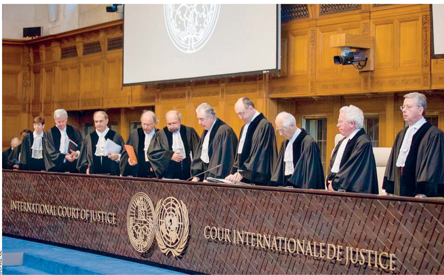
LA CORTE INTERNACIONAL DE JUSTICIA DE LA HAYA YA FIJÓ LAS FECHAS PARA LA SIGUIENTE FASE DE LA DEMANDA MARÍTIMA DE BOLIVIA CONTRA CHILE.