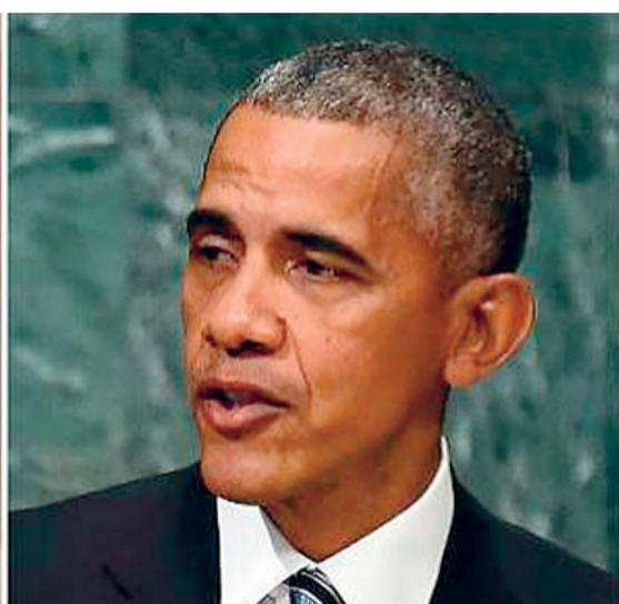
LA CARTA DE UN NIÑO AL PRESIDENTE BARACK OBAMA SE HIZO VIRAL.