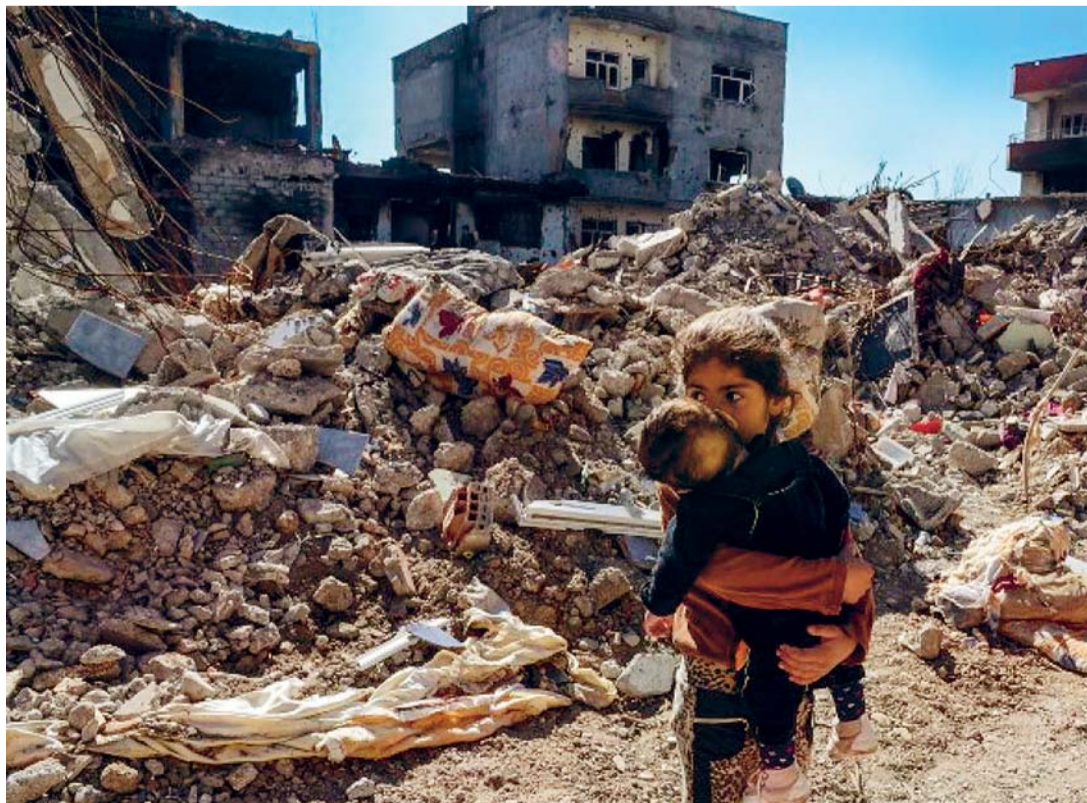
UNO DE CADA TRES NIÑOS SIRIOS SOLO CONOCE LA GUERRA.