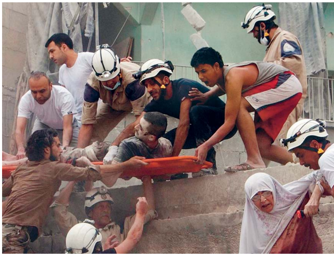
LAS VÍCTIMAS DE LOS BOMBARDEOS SON SOCORRIDOS Y OTROS QUEDARON BAJO ESCOMBROS, LUEGO DEL ATAQUE AÉREO SOBRE UN HOSPITAL EN ALEPO.