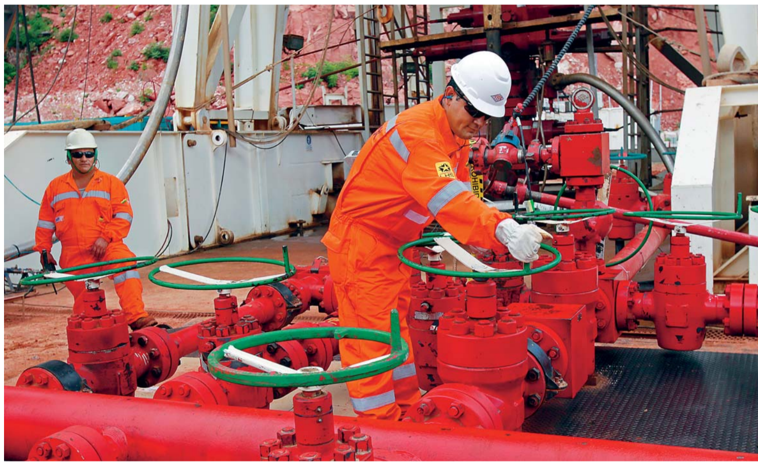
LA DEMANDA DEL GAS BOLIVIANO SUBE EN EL PAÍS, YA QUE EL CONSUMO INTERNO LOGRÓ SUPERAR AL ENVÍO QUE SE REALIZA HACIA ARGENTINA.

• El volumen entregado el 22 de septiembre de 2016 a Argentina fue de 14.42 millones de metros cúbicos día (MMcd), mientras que el consumo interno del país fue 14.97 MMcd, según el Viceministerio de Hidrocarburos y Energía. Dos exministros cuestionaron al Gobierno por la ausencia de transparencia en información relacionada con el sector