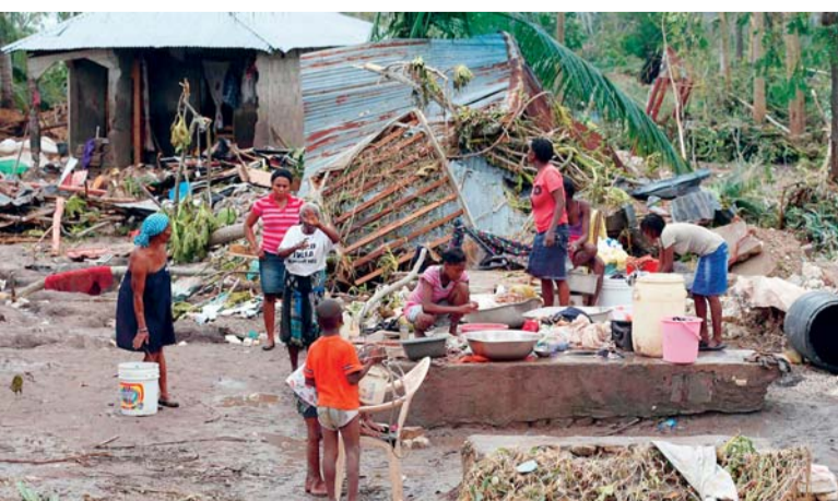
EL HURACÁN MATTHEW PROVOCÓ 540 MUERTOS, 128 DESAPARECIDOS Y 175.000 DESPLAZADOS.

La Organización de Naciones Unidas (ONU) lamentó ayer la "pobre" respuesta de los donantes a su solicitud de fondos de emergencia para apoyar a Haití tras el huracán Matthew, y dijo que por el momento solo ha recibido 15 de los 120 millones de dólares que considera necesarios.