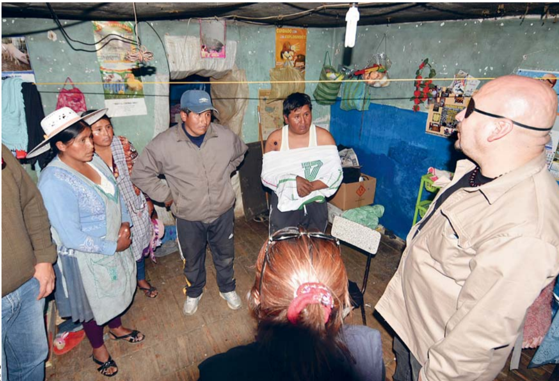
EL DEFENSOR DEL PUEBLO, DAVID TEZANOS PINTO, VISITÓ LA LOCALIDAD MINERA DE VILOCO Y SE ENTREVISTÓ CON EL MINERO ÁNGEL APARAYA.

• Ministerio de Gobierno afirma que hay nueve prófugos implicados en muerte de viceministro Rodolfo Illanes