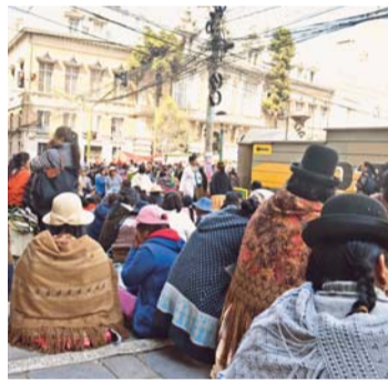
LA PAZ COLAPSADA POR UN SECTOR QUE MOVILIZA PARA EVITAR UNA DETERMINACIÓN MUNICIPAL.