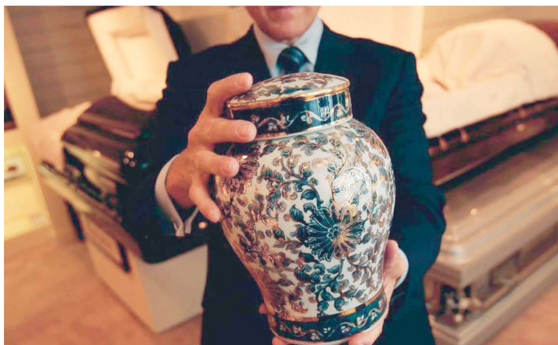
LOS DOLIENTES CATÓLICOS YA NO PODRÁN CONSERVAR EN CASA LAS CENIZAS DE LOS CUERPOS DE SUS SERES QUERIDOS DIFUNTOS.