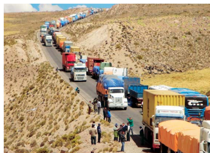
CAMIONES BOLIVIANOS QUE RESULTAN PERJUDICADOS POR PROBLEMAS INTERNOS EN CHILE.

A partir de hoy, al menos 200 camiones salen de Bolivia y deben ingresar otros 100 como actividad del comercio exterior, nuevamente resultarán perjudicados por un anunciado paro determinado por la Asociación Nacional de Empleados Fiscales, la misma que agremia al Servicio Agrícola y Ganadero de Chile y la Aduana Chilena, instituciones que operan la Terminal Puerto de Arica (TPA).