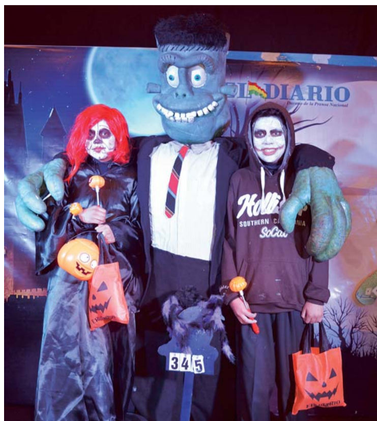
LA MAGIA DEL DISFRAZ NUEVAMENTE SERÁ PLASMADA EN LA TOMA DE FOTOGRAFÍAS HALLOWEEN EL DIARIO 2016.