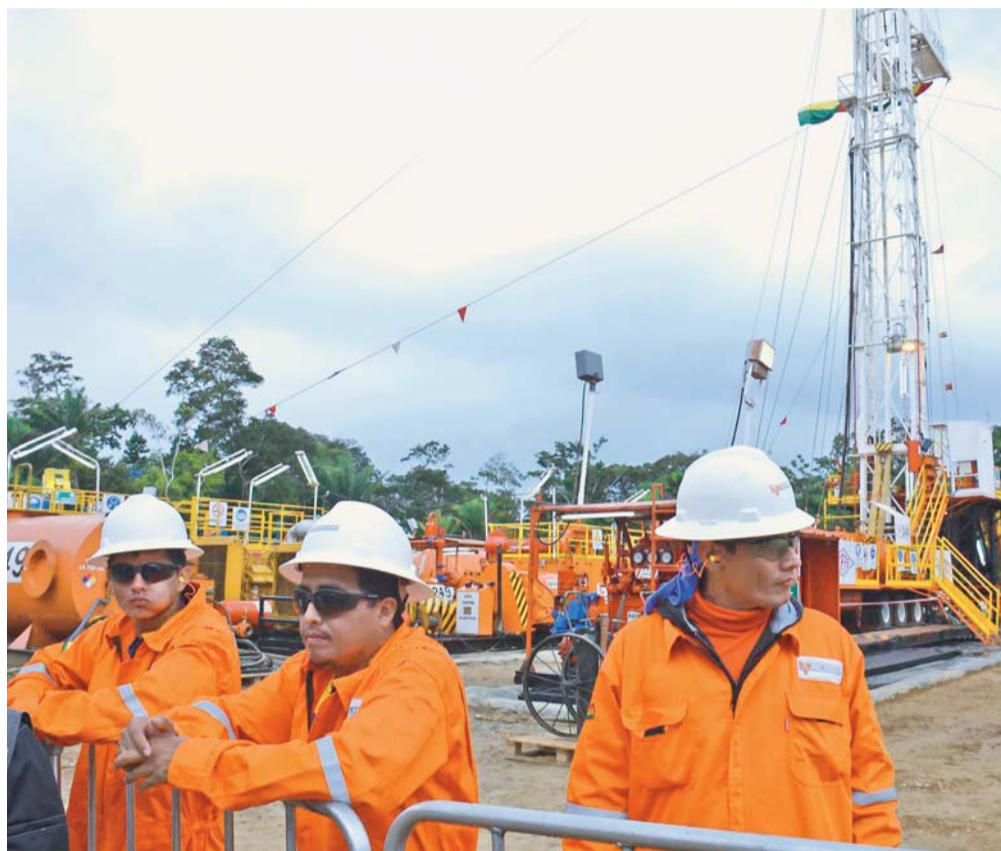
GOBIERNO CONFÍA RECUPERAR EL REZAGO DE LA PRODUCCIÓN GASÍFERA.