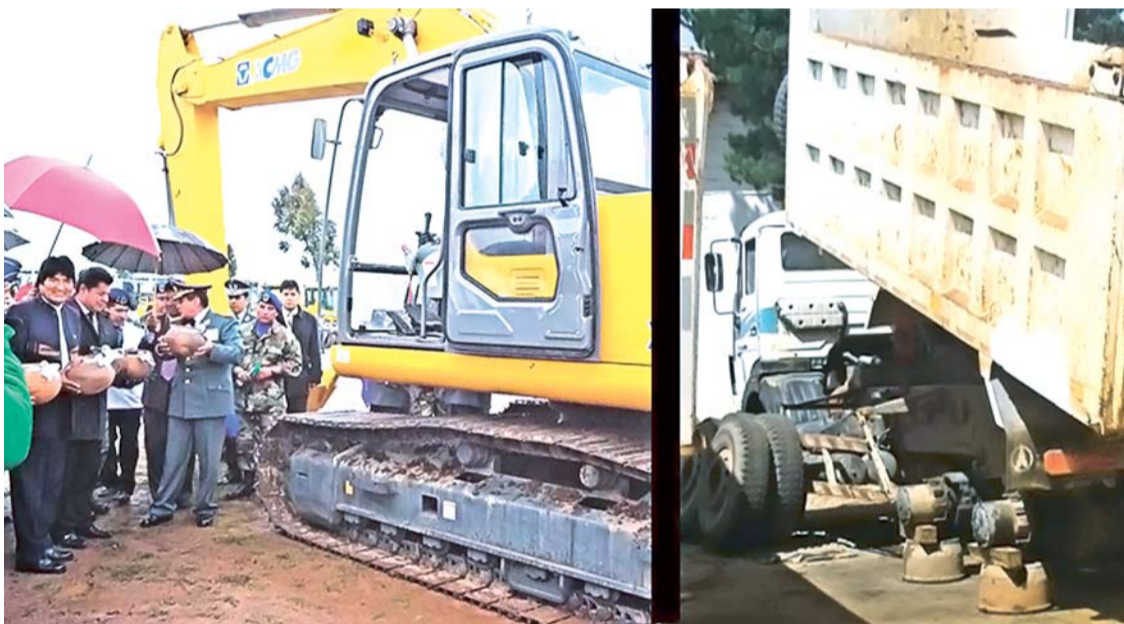
DOS APARIENCIAS DE LA MAQUINARIA: A LA IZQUIERDA EN EL 2012 CUANDO FUE "CHALLADA" Y A LA DERECHA EN EL 2016 CUANDO YA NO TIENE UTILIDAD ALGUNO. BOLIVIA PAGÓ MÁS DE 40 MILLONES DE DÓLARES POR ESE LOTE A LA EMPRESA CHINA NORINCO.