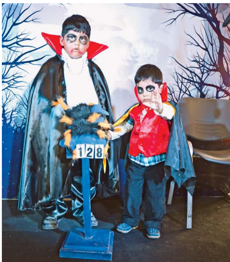
LA CREATIVIDAD E INGENIO EN LOS DISFRACES SERÁN DESTACADOS POR EL DIARIO EN HALLOWEEN.