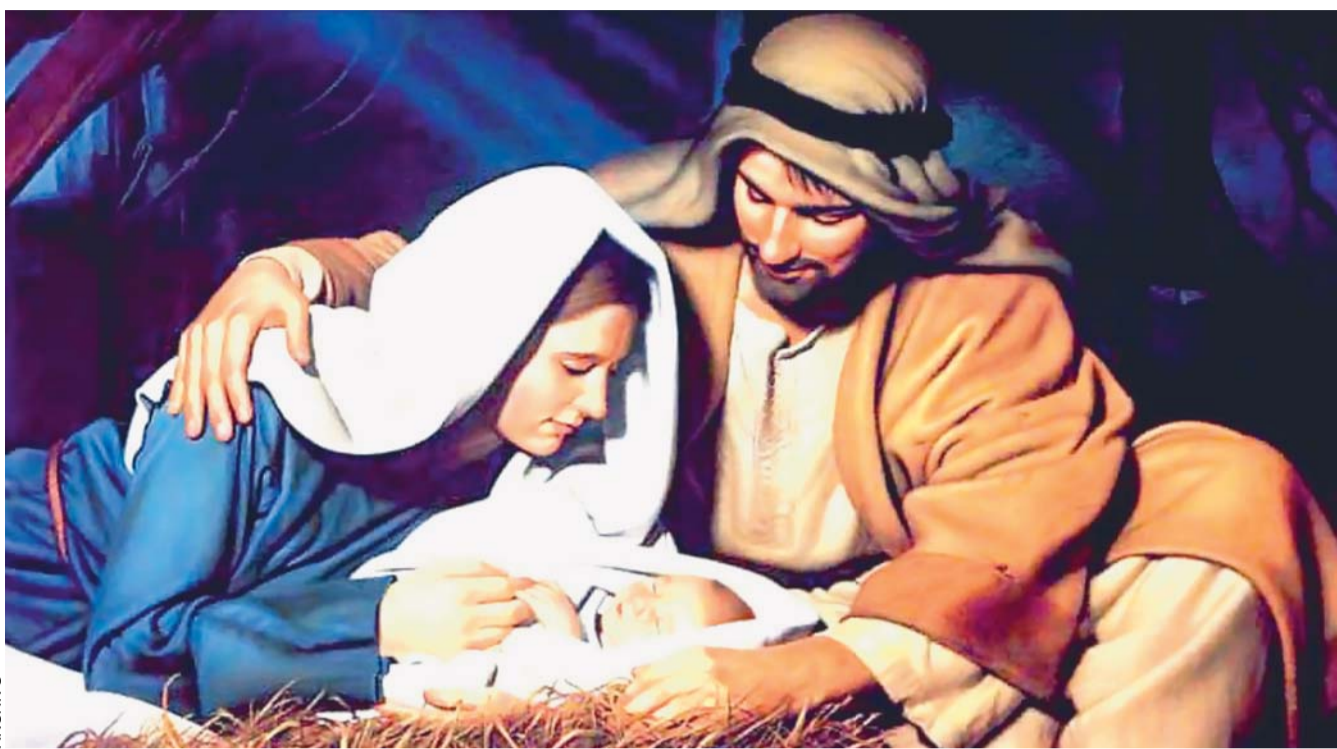
EN EL FUTURO, JESUCRISTO VOLVERÁ A REINAR EN LA TIERRA EN PAZ DURANTE MIL AÑOS. JESUCRISTO ES EL HIJO DE DIOS Y ÉL SERÁ NUESTRO SEÑOR PARA SIEMPRE. EL DIARIO LES DESEA ¡FELIZ NAVIDAD A TODOS!

Jesucristo es el Salvador del mundo y el Hijo de Dios. Él es nuestro Redentor. La Santa Biblia nos enseña que la madre de Jesucristo fue María, que su padre en la Tierra fue José, que nació en Belén y creció en Nazaret, y que trabajó como carpintero con José. Cuando cumplió los 30 años, empezó un ministerio de tres años durante los que enseñó, bendijo y sanó a las personas de la Tierra Santa. Asimismo, organizó su Iglesia y dio a sus apóstoles "poder y autoridad" (Lucas 9:1) para ayudarle en su obra.