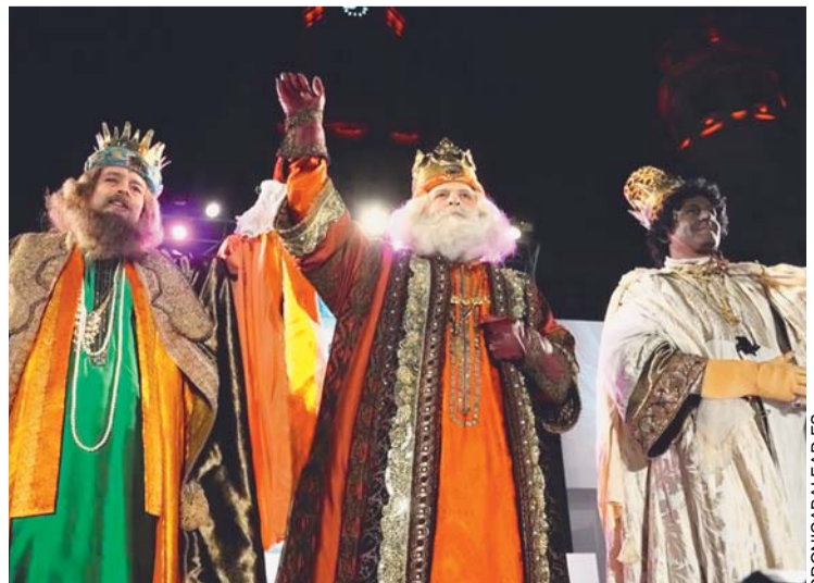
SUS MAJESTADES LLEGARÁN A DISTINTOS PUNTOS POR AIRE, POR MAR Y HASTA EN CABALLO.