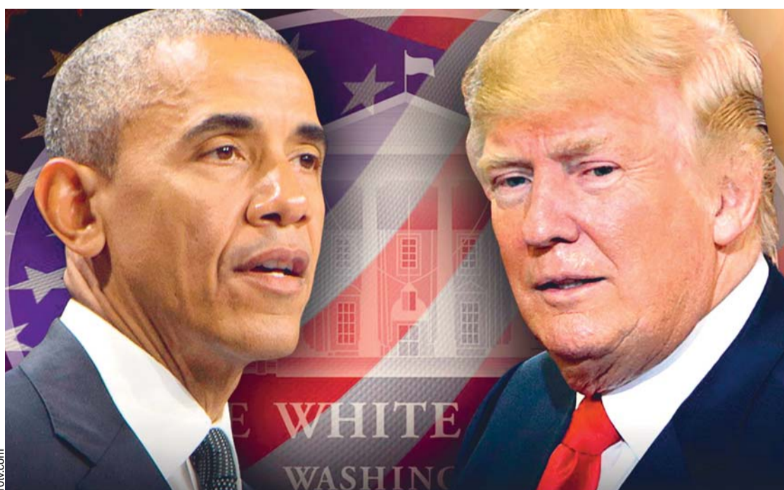
BARACK OBAMA DEJA EL PODER A DONALD TRUMP.

El presidente electo de Estados Unidos, Donald Trump, inició ayer la agenda de actos oficiales de su investidura con una ofrenda floral en la tumba del soldado desconocido en el cementerio militar de Arlington (Virginia). El presidente Trump y su vicepresidente, Mike Pence, colocaron la corona de flores de manera solemne y en silencio en una ceremonia en la que se rindieron honores castrenses.