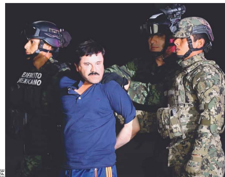
EL GOBIERNO MEXICANO ENTREGÓ A LAS AUTORIDADES DE ESTADOS UNIDOS AL LÍDER DEL CÁRTEL DE SINALOA.