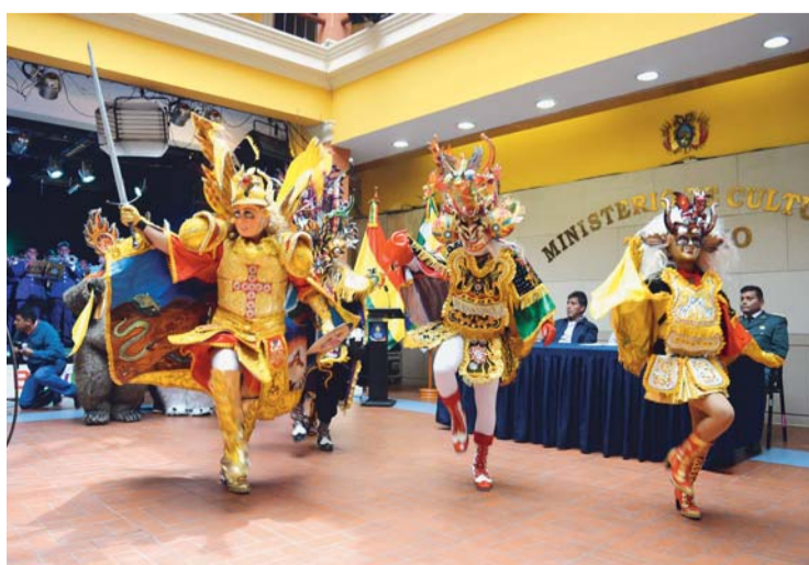
LA DANZA DE LA DIABLADA.