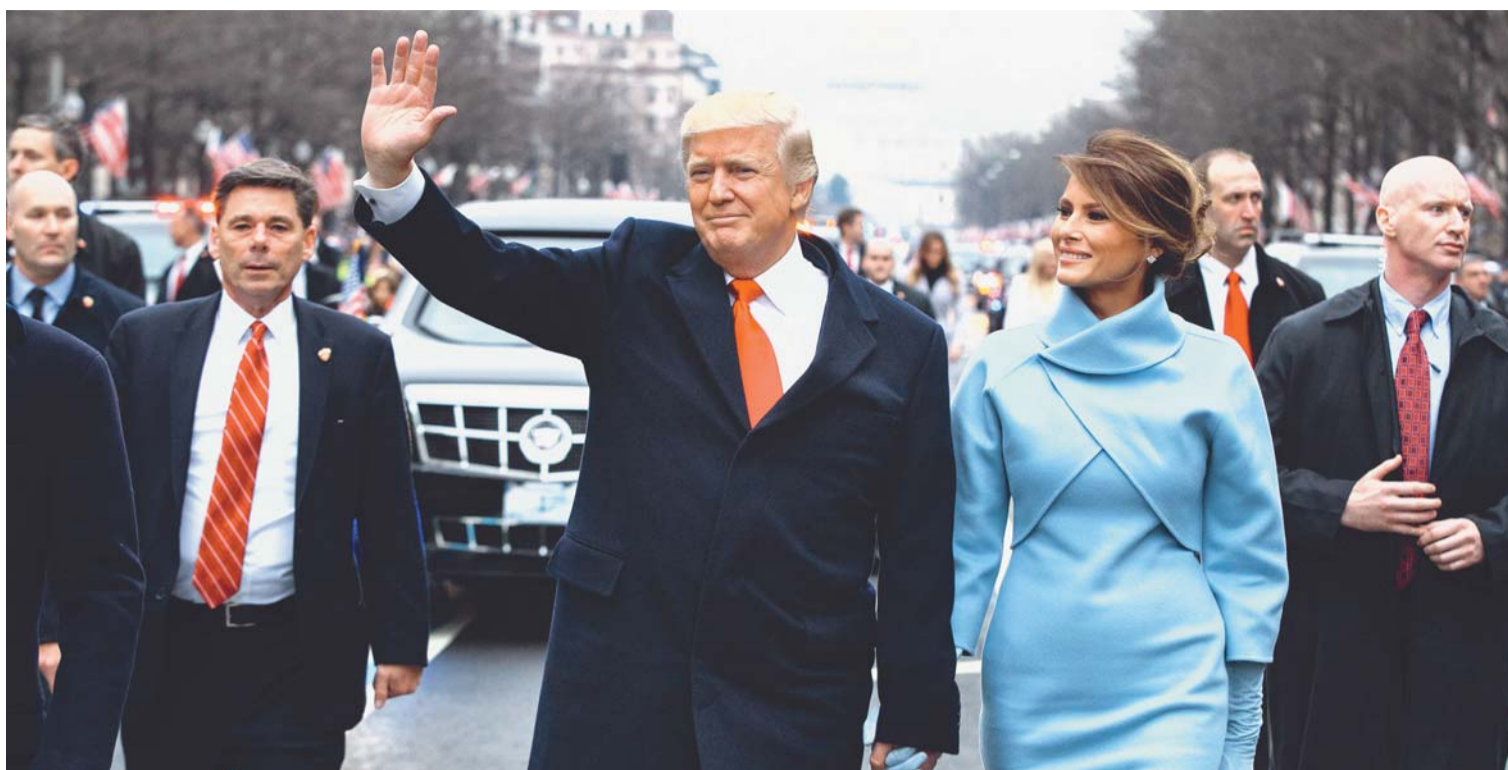
EL MAGNATE REPUBLICANO DONALD TRUMP SE CONVIRTIÓ EN EL PRESIDENTE NÚMERO 45 DE LA HISTORIA DE ESTADOS UNIDOS. ESTARÁ AL MANDO DEL PAÍS HASTA ENERO DE 2021. EN LA FOTO, EL NUEVO MANDATARIO NORTEAMERICANO CAMINA CON LA PRIMERA DAMA MELANIA TRUMP DURANTE EL DESFILE INAUGURAL.