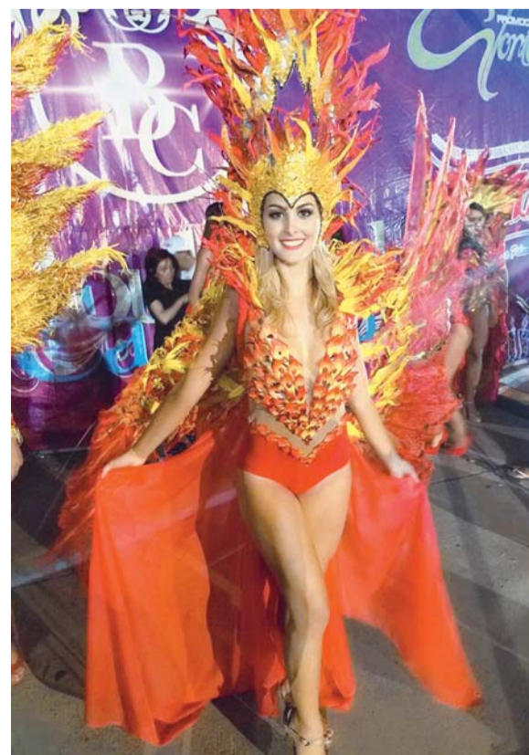
EL PÚBLICO QUEDÓ ENCANTADO CON EL CARNAVAL CRUCEÑO QUE SE DESARROLLÓ EL VENTURA MALL.