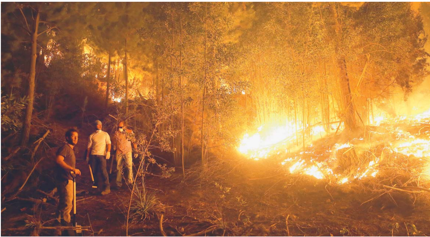
LOS PAÍSES EUROPEOS SE MOVILIZAN CON LA FINALIDAD DE PRESTAR AYUDA A CHILE EN TRAGEDIA POR INCENDIOS QUE ARRASÓ 360.000 HECTÁREAS.