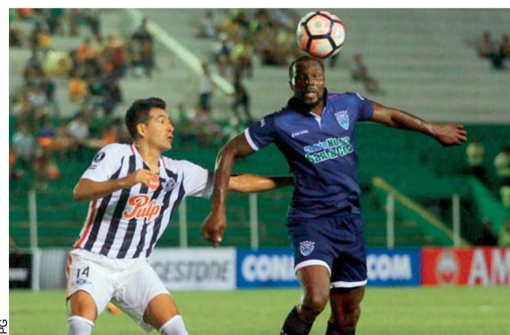
Sport Boys debuta con empate

El equipo Sport Boys igualó las acciones en tres ocasiones a lo largo del partido disputado ante Libertad, de Paraguay, anoche en el estadio Ramón Aguilera Costas, su estreno tuvo un camino espinoso por delante desde el principio.