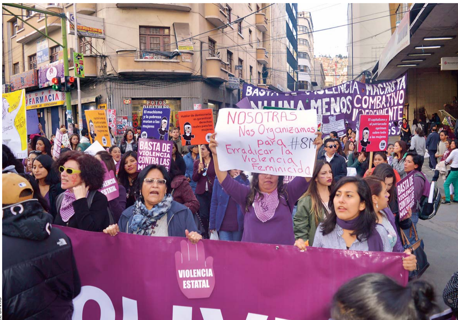
EN LA CIUDAD DE LA PAZ, LA MOVILIZACIÓN DE LAS MUJERES FUE DE JORNADA COMPLETA, LUEGO DEL PARO, SE CUMPLIÓ UNA CONCENTRACIÓN EN SAN FRANCISCO Y UNA POSTERIOR MOVILIZACIÓN.