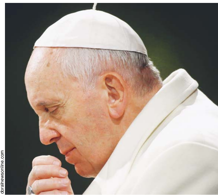
JORGE BERGOGLIO EN SU QUINTA PASCUA COMO PAPA.