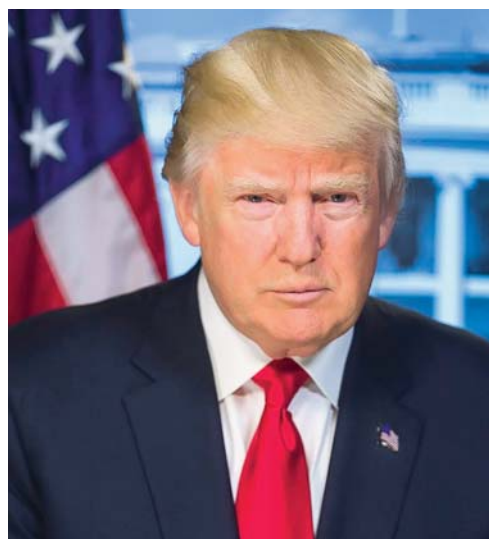
PRESIDENTE DE EEUU, DONALD TRUMP.

• Gobierno estadounidense trabaja con aliados internacionales y el Gobierno chino para acabar con las provocaciones de Corea del Norte, tras el fallido lanzamiento de un misil. Autoridades de China advierten que un "conflicto podría estallar en cualquier momento", por lo que sostienen que "el diálogo es la única salida"