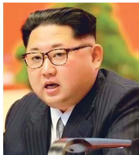
PRESIDENTE DE COREA DEL NORTE, KIM JONG-UN.

Estados Unidos trabaja con sus aliados internacionales y con el Gobierno chino para "elaborar una gama de opciones" que estén listas si Corea del Norte persiste en su "patrón desestabilizador y provocador" y se niega a "desnuclearizarse".