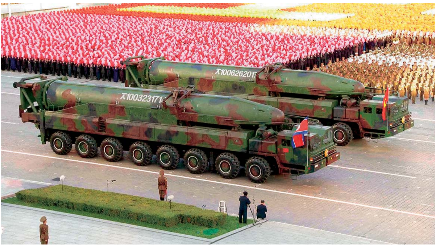
COREA DEL NORTE ANUNCIÓ QUE REALIZARÁ PRUEBAS DE MISILES CON FRECUENCIAS SEMANALES. "ESTAMOS LISTOS PARA RESPONDER A CUALQUIER GUERRA", PUNTUALIZAN.