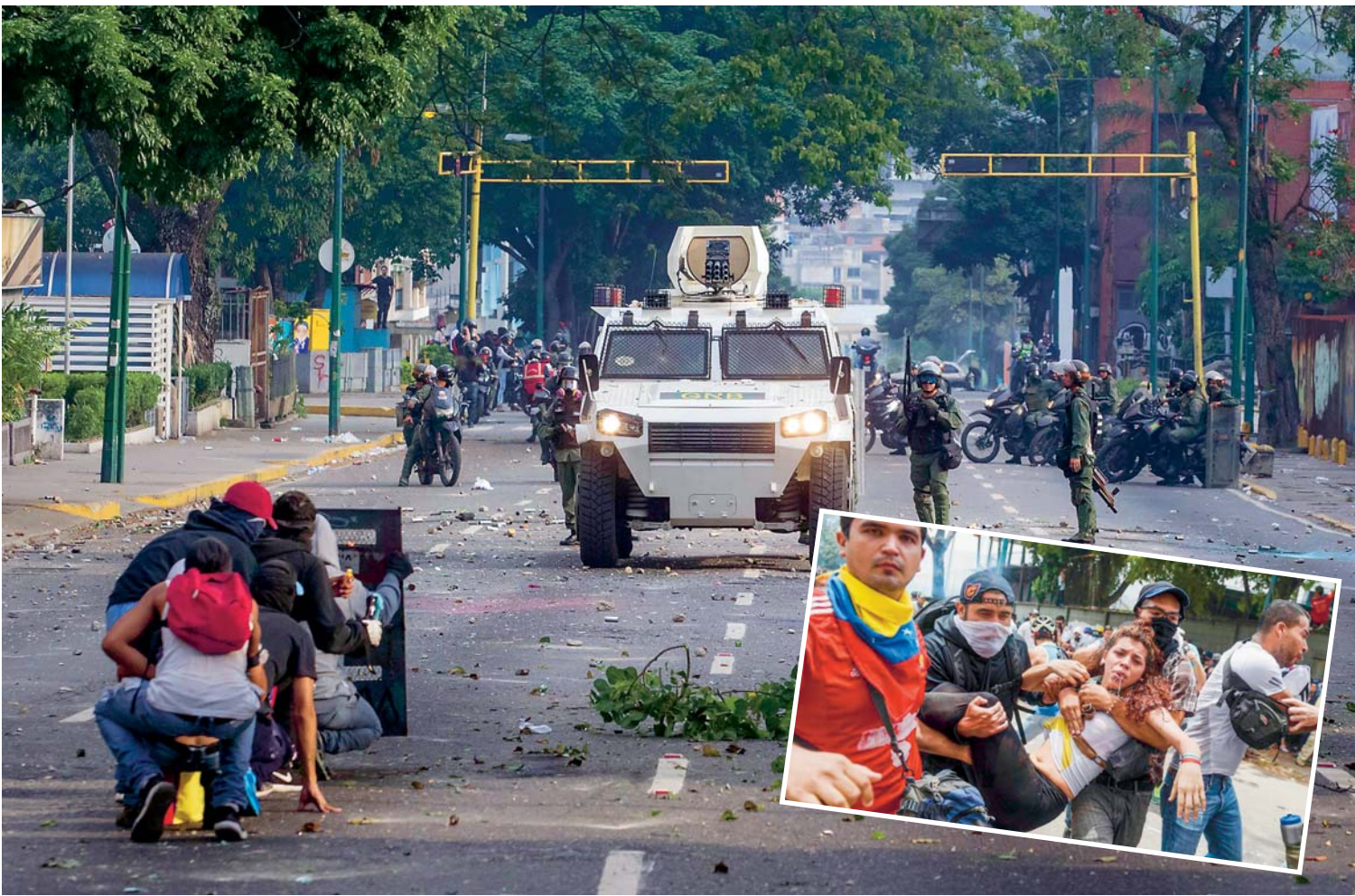
MIEMBROS DE LA GUARDIA NACIONAL BOLIVARIANA (GNB, POLICÍA MILITARIZADA) DISOLVIERON CON GASES LACRIMÓGENOS LA CONCENTRACIÓN Opositora EN LA ZONA DEL PARAÍSO, TAMBIÉN AL OESTE DE CARACAS, CUANDO INTENTABAN LLEGAR HACIA EL CENTRO, LO QUE ORIGINÓ EL ENFRENTAMIENTO CON ALGUNOS MANIFESTANTES QUE RESPONDIERON LANZANDO PIEDRAS A LOS AGENTES.