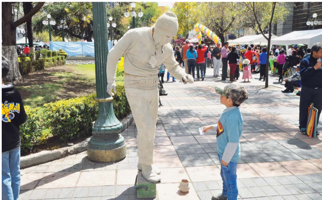
LOS NIÑOS FUERON QUIENES MÁS DISFRUTARON DEL PRIMER DOMINGO DE FERIA EN CENTRO PACEÑO.