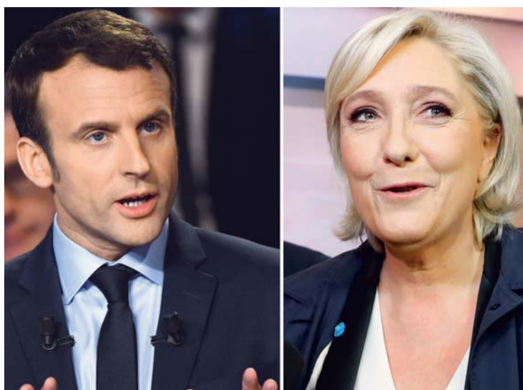
EMMANUEL MACRON Y MARINE LE PEN PASARON A SEGUNDA VUELTA POR LA PRESIDENCIA DE FRANCIA.