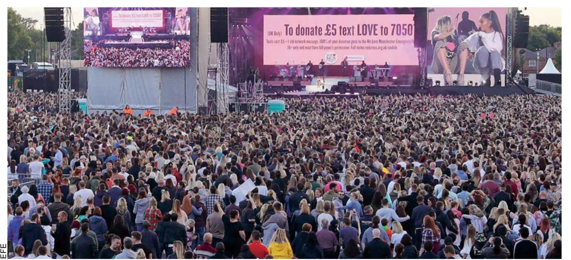
ARTISTAS INTERNACIONALES REUNIDOS EN UN ESCENARIO PARA HOMENAJEAR A LAS VÍCTIMAS Y AFECTADOS DEL TERRORISMO EN GRAN BRETAÑA.

Si desea conocer mayores detalles, le invitamos a revisar nuestra nueva edición de hoy para conocer esos beneficios.