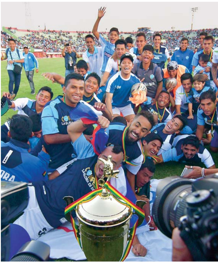
FESTEJO DE LOS CELESTES COCHABAMBINOS LUEGO DEL ASCENSO A LA LIGA PROFESIONAL DEL FÚTBOL BOLIVIANO.