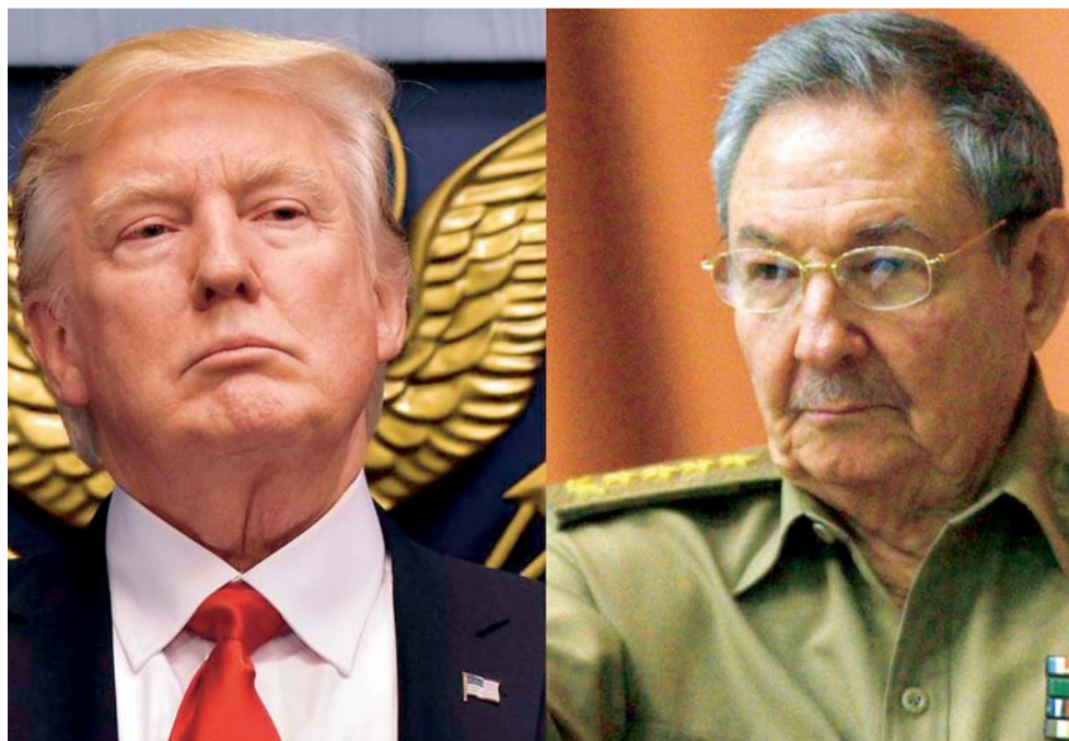
DONALD TRUMP ESTÁ DISPUESTO A NEGOCIAR NUEVO ACUERDO CON RAÚL CASTRO SI SE LIBERAN A PRESOS POLÍTICOS.

El cambio de política hacia Cuba anunciado ayer por el presidente de Estados Unidos, Donald Trump, incluye su apoyo al embargo comercial y financiero estadounidense a la isla y la oposición a las peticiones internacionales de que el Congreso lo levante, informó la Casa Blanca.