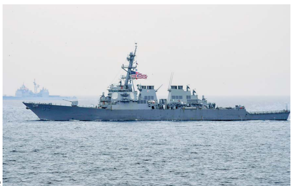
LA TELEVISORA JAPONESA NHK MOSTRÓ IMÁGENES EN LAS QUE SE VEÍA A UNA PERSONA SER SUBIDA A UN HELICÓPTERO EN UNA CAMILLA.

El destructor de 154 metros (505 pies) de inmediato solicitó la asistencia de la Guardia Costera de Japón, reportó el canal CNN.