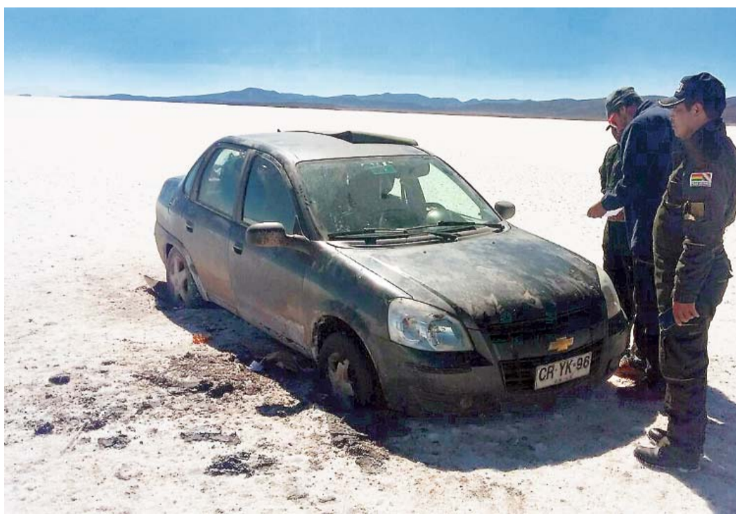
DOS EQUIPOS DE BÚSQUEDA, LUEGO DE 18 HORAS CONTINUAS, LOGRARON DAR CON LOS TRES EXTRANJEROS, QUIENES AGRADECIERON A LA POLICÍA, POR LA REACCIÓN INMEDIATA.