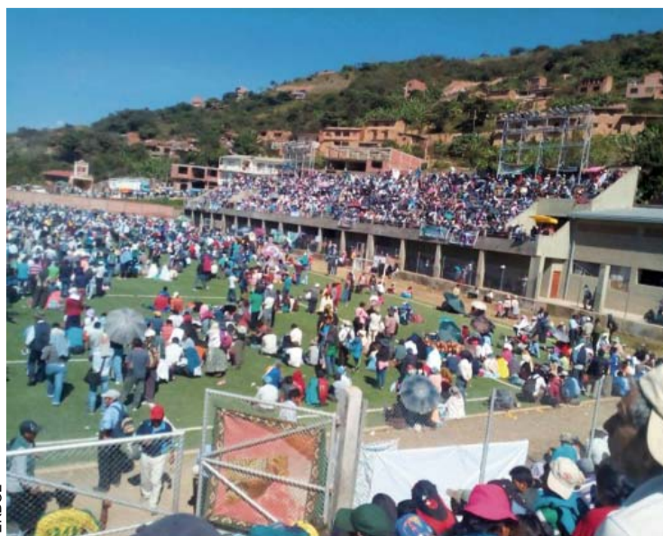
ASAMBLEA DE CORIPATA LE DICE "NO" A LA LEY DE COCA.

Asimismo, decidieron "no permitir el ingreso de funcionarios de Gobierno" y el ministro de Desarrollo Rural y Tierras, César Cocarico, fue declarado persona no grata por lo sucedido recientemente. (Erbol)