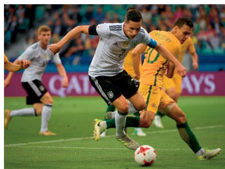
JULIAN DRAXLER FUE EL CONDUCTOR DE LA ESCUADRA ALEMANA.