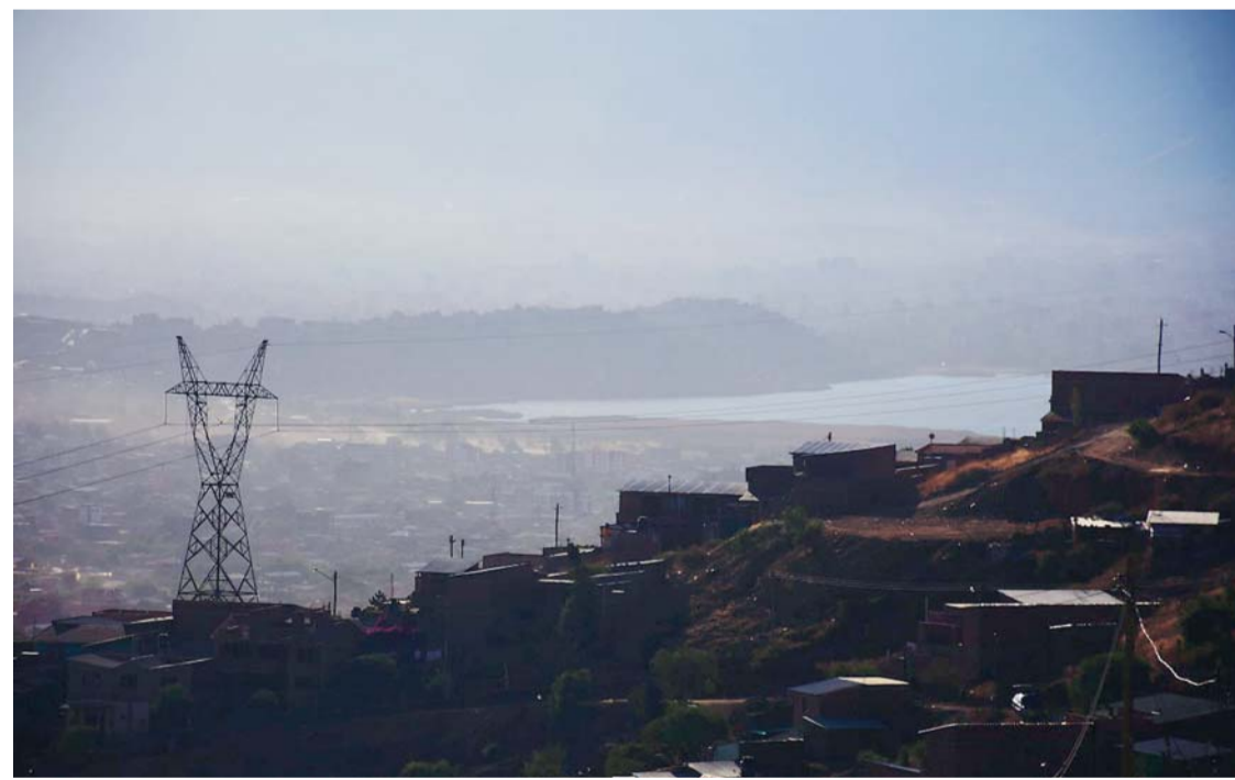
LAS LADRILLERAS Y EL PARQUE AUTOMOTOR CAUSAN DAÑOS AL MEDIOAMBIENTE EN LA CIUDAD VALLUNA.

La contaminación ambiental llega a niveles insostenibles en este mes en Cochabamba, la densa humareda afecta a los pobladores que tienen dificultad para respirar, ya que el dióxido de carbono, polvo y hollín se asientan a pocos metros del suelo durante las madrugadas por el descenso de las temperaturas.