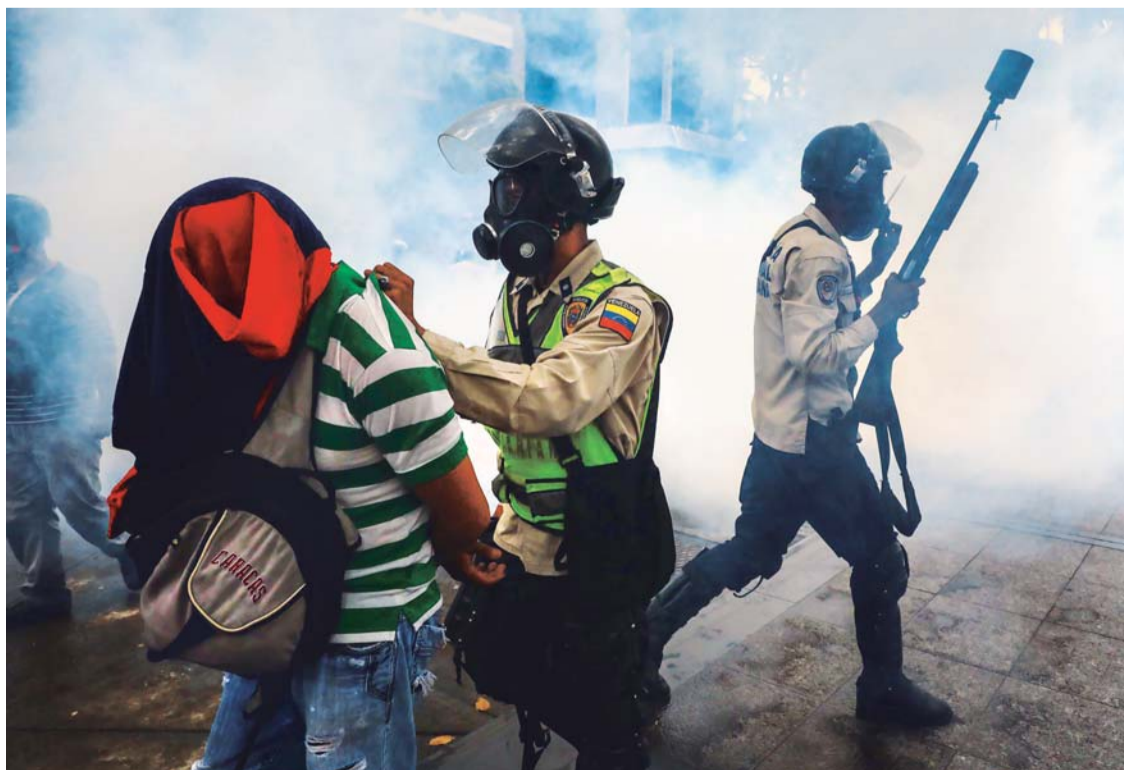
CIENTOS DE CIUDADANOS DE TODO EL PAÍS SALIERON NUEVAMENTE A LAS CALLES AL ATENDER EL LLAMADO DE LA MESA DE LA UNIDAD DEMOCRÁTICA. MÁS DE 20 JÓVENES FUERON DETENIDOS POR LAS FUERZAS DE SEGURIDAD.