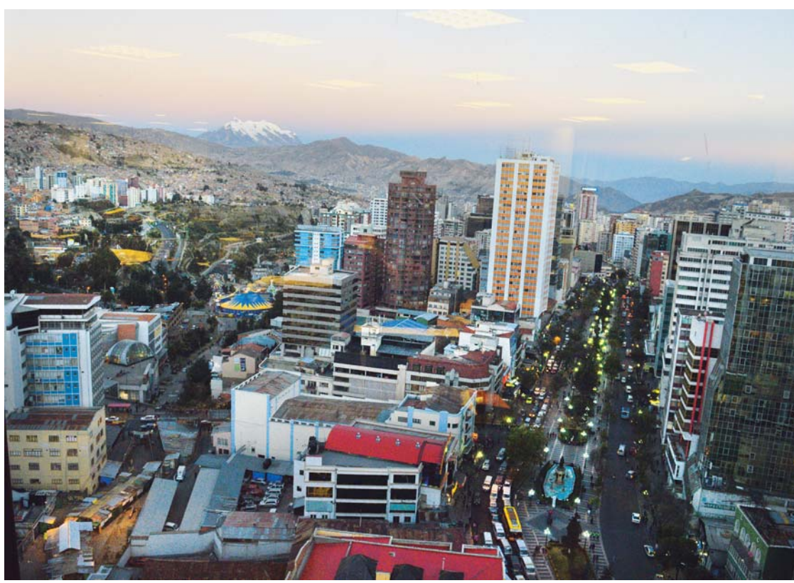
LA PAZ ES UNA DE LAS CIUDADES LATINOAMERICANAS QUE ALCANZÓ EL GALARDÓN MUNDIAL. LAS OTRAS CIUDADES MARAVILLAS PERTENECEN A PAÍSES ÁRABES, AFRICANOS Y ASIÁTICOS.