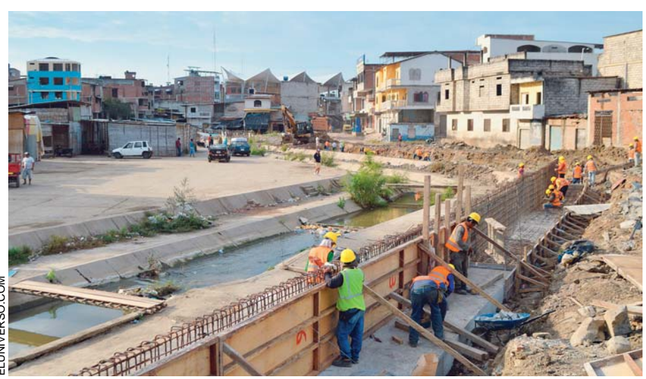
PERÚ PIDIÓ A ECUADOR PARALIZAR CONSTRUCCIÓN DE UN MURO EN EL CANAL INTERNACIONAL DE ZARUMILLA.

Los municipios fronterizos de Aguas Verdes (Perú) y Huaquillas (Ecuador) son prácticamente una misma ciudad, separadas por un canal de agua mínimo que se puede cruzar con un salto durante la mayor parte del año.