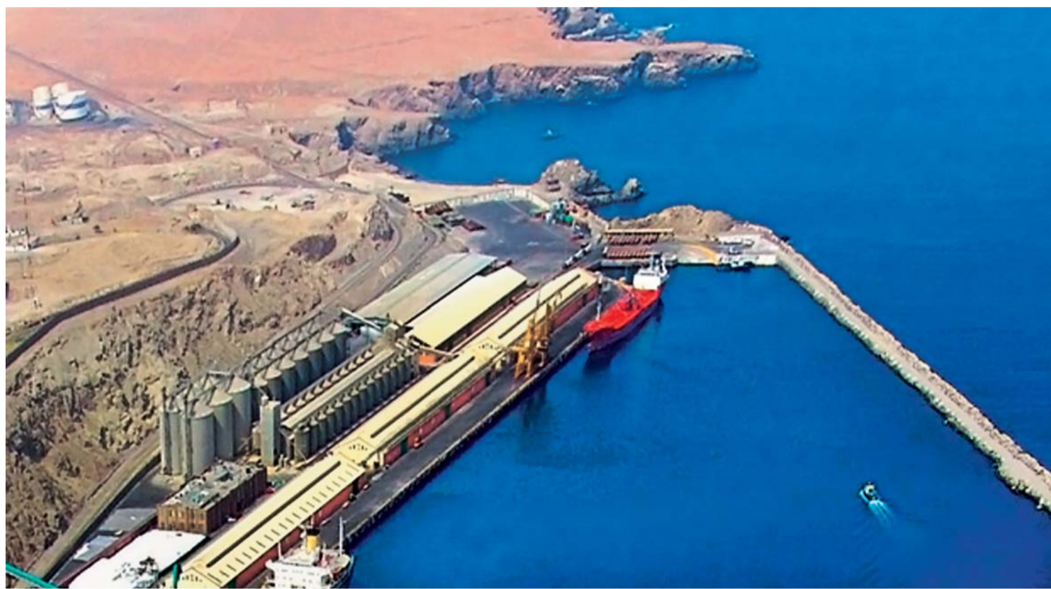
LA CARGA BOLIVIANA PODRÁ SER EXPORTADA E IMPORTADA A TRAVÉS DEL PUERTO DE ILO.

Un convenio interestatal será suscrito el martes 8 de este mes por la Empresa Nacional de Puertos del Perú (Enapu) y la Administradora de Servicios Portuarios de Bolivia (ASPB), que permitirá al país exportar al menos unas 60 mil toneladas de carga por el puerto de Ilo y convertirlo, posteriormente, en un muelle formal de exportación e importación.