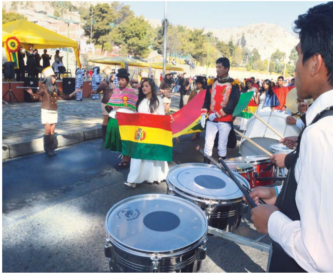
LOS DESFILES EN EL PAÍS EXPRESARON EL ORGULLO DE SER BOLIVIANO.

Durante la jornada de ayer el civismo imperó en la ciudad de La Paz y en el resto del país. Las principales avenidas de los macrodistritos de la urbe paceña se llenaron de estudiantes y funcionarios públicos, para rendir homenaje a la Patria por sus 192 años de Independencia.