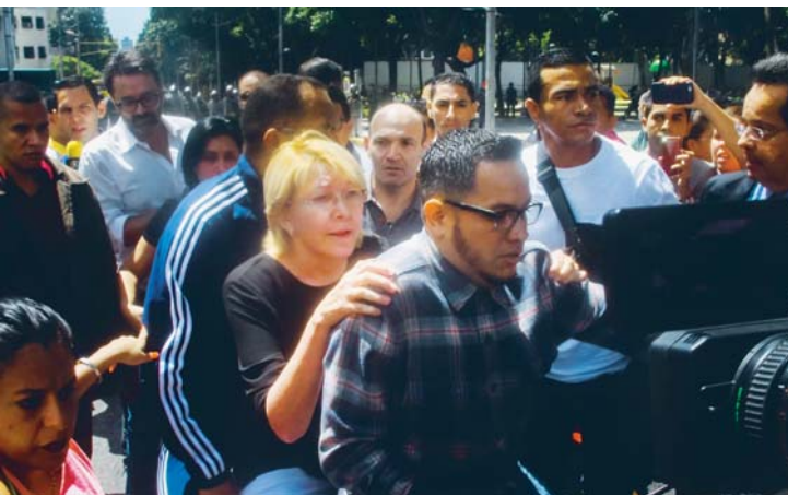
FUERZAS MILITARES RODEARON EL MINISTERIO PÚBLICO EN CARACAS PARA IMPEDIR EL INGRESO DE LA FISCAL LUISA ORTEGA.