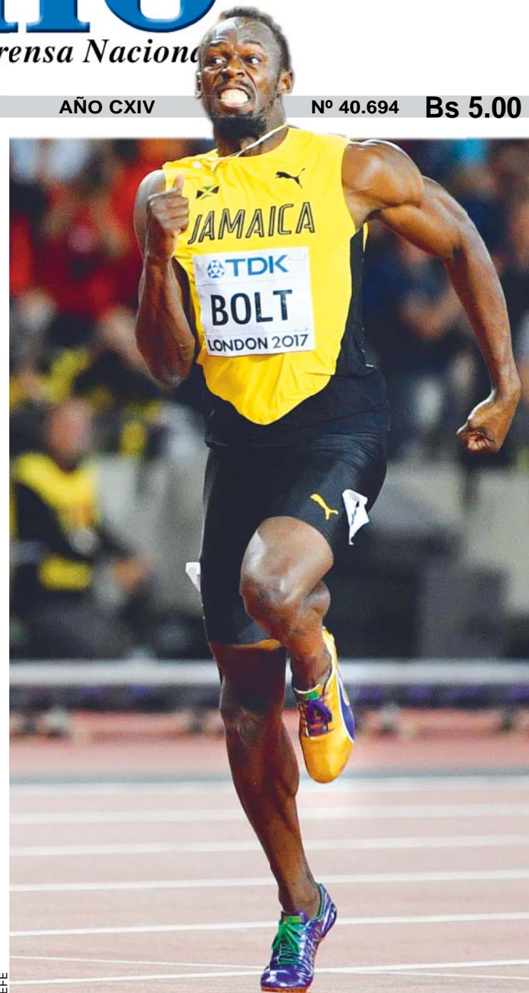
USAIN BOLT SE DESPIDIÓ DEL MUNDIAL DE LONDRES CON MEDALLA DE BRONCE.

Inf. Pág. 4 y 6, 1er. Cuerpo Inf. Pág. 7, 5to. Cuerpo