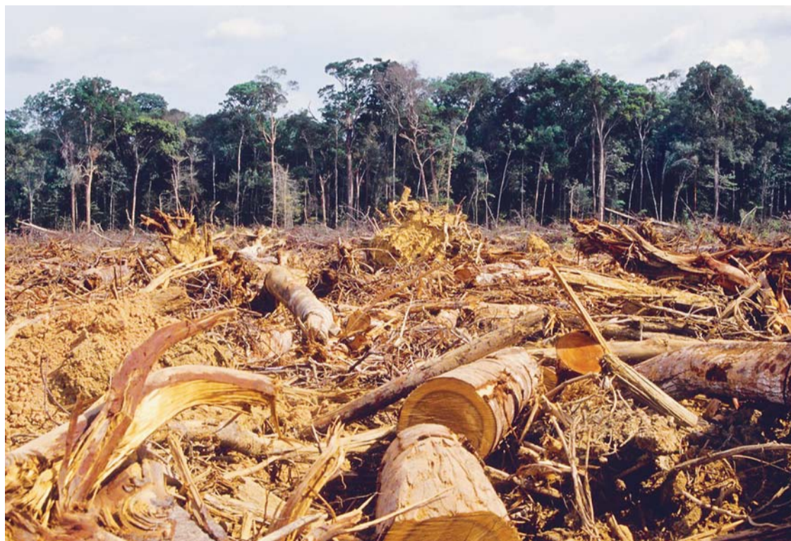
PAÍSES DE LATINOAMÉRICA ATENTAN CONTRA LA BIODIVERSIDAD, POR LA ALARMANTE DEFORESTACIÓN.