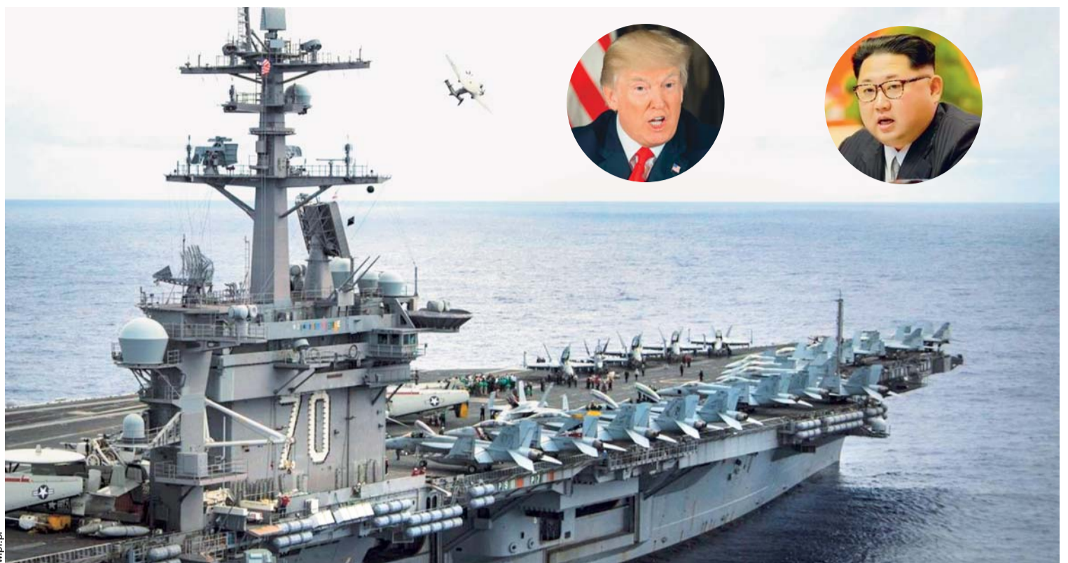
EL RÉGIMEN NORCOREANO HA AMENAZADO CON ATACAR LAS BASES MILITARES DE ESTADOS UNIDOS EN LA ISLA DE GUAM, HORAS DESPUÉS DE QUE EL PRESIDENTE DONALD TRUMP ELEVARA EL TONO DE SUS ADVERTENCIAS A PYONGYANG Y DE QUE EL PENTÁGONO ENVIARA DE NUEVO BOMBARDEROS B-1B A LA PENÍNSULA.