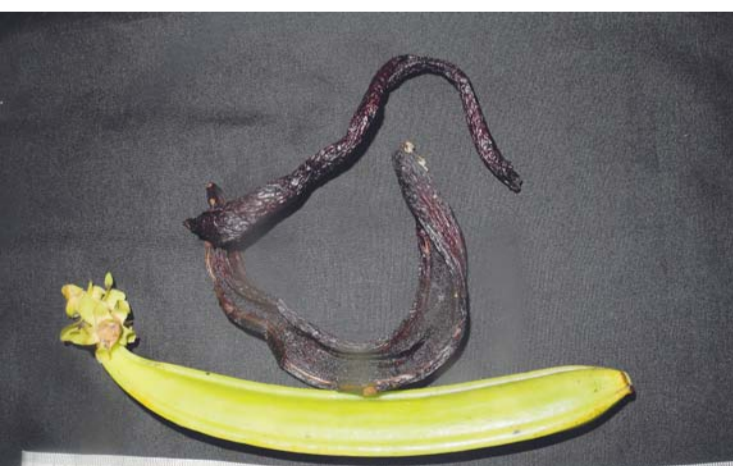
EN EL PAÍS EXISTEN SEIS ESPECIES DE VAINILLAS.