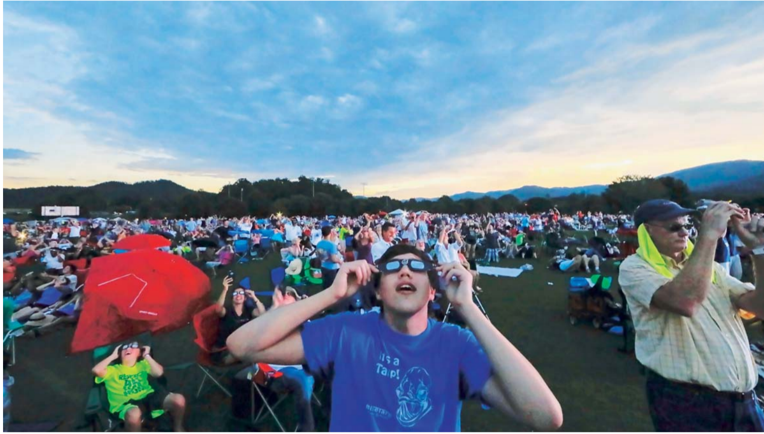
ESTADOS UNIDOS QUEDÓ PARALIZADO PARA CONTEMPLAR EL PRIMER ECLIPSE SOLAR TOTAL DESDE HACE 99 AÑOS QUE HA RECORRIDO EL PAÍS NORTEAMERICANO DE COSTA A COSTA.