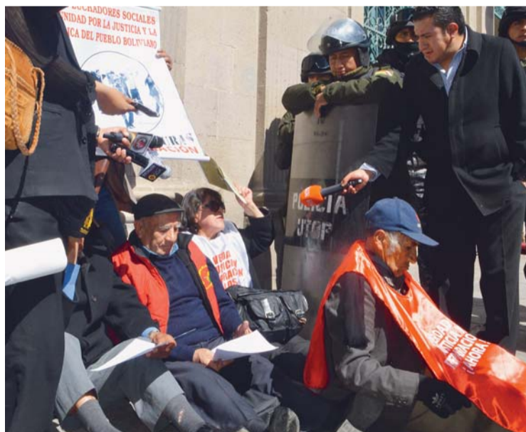
UN GRUPO DE PERSONAS, VÍCTIMAS DE LAS DICTADURAS, INTENTÓ INGRESAR AL PALACIO DE GOBIERNO PARA ASISTIR AL ACTO DE POSESIÓN; SIN EMBARGO, LA POLICÍA LOS ALEJÓ DE LA PUERTA PRINCIPAL.