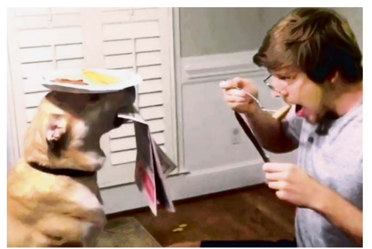
FINLEY ES UNO DE LOS PERROS MÁS FIELES DE INTERNET, SU TRANQUILIDAD Y PACIENCIA LO LLEVÓ A SER UNA DE LAS MASCOTAS MÁS QUERIDAS POR EL PÚBLICO.

Finley se encuentra más que comprometido a la hora de complacer a su dueño, desde sostenerle el diario para su lectura, hasta cumplir la función de una mesa de luz.