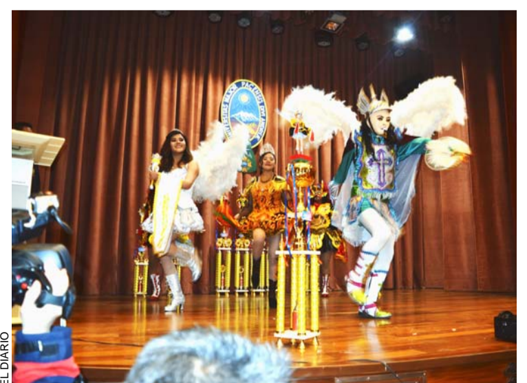
ESTUDIANTES DE LA CARRERA DE MEDICINA FESTEJAN, LUEGO DE HABER GANADO EN LA XXX ENTRADA FOLKLÓRICA UNIVERSITARIA 2017.