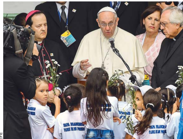
EL PAPA FRANCISCO RECIBE A NIÑOS DE FAMILIAS DESFAVORECIDAS EN EL INSTITUTO HOGAR SAN JOSÉ, MEDELLÍN, COLOMBIA.

“El Papa es una fuente de inspiración muy grande para mí porque se ha untado de pueblo con su lema de ser pastores con olor a oveja, pastores metidos en el pueblo”, dijo a Efe el sacerdote Jhonny Guarín, de la diócesis Sonsón-Rionegro (Antioquia).