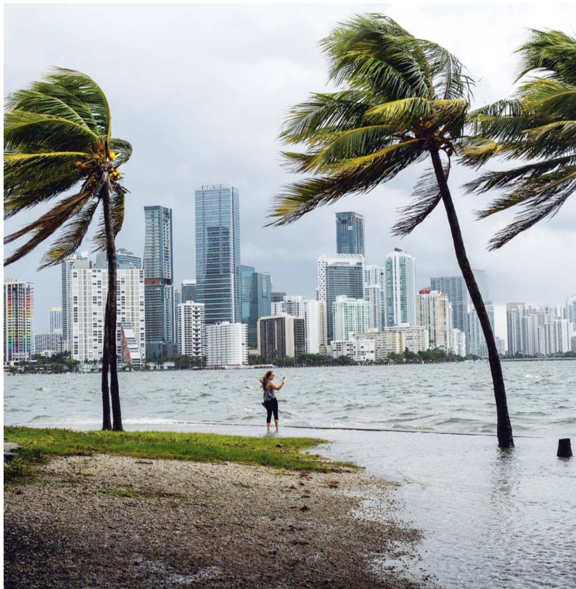
VISTA DE LA BAHÍA DE BISCAYNE CON FUERTES VIENTOS Y OLAS, POR LA LLEGADA DEL HURACÁN IRMA EN MIAMI, FLORIDA (ESTADOS UNIDOS).