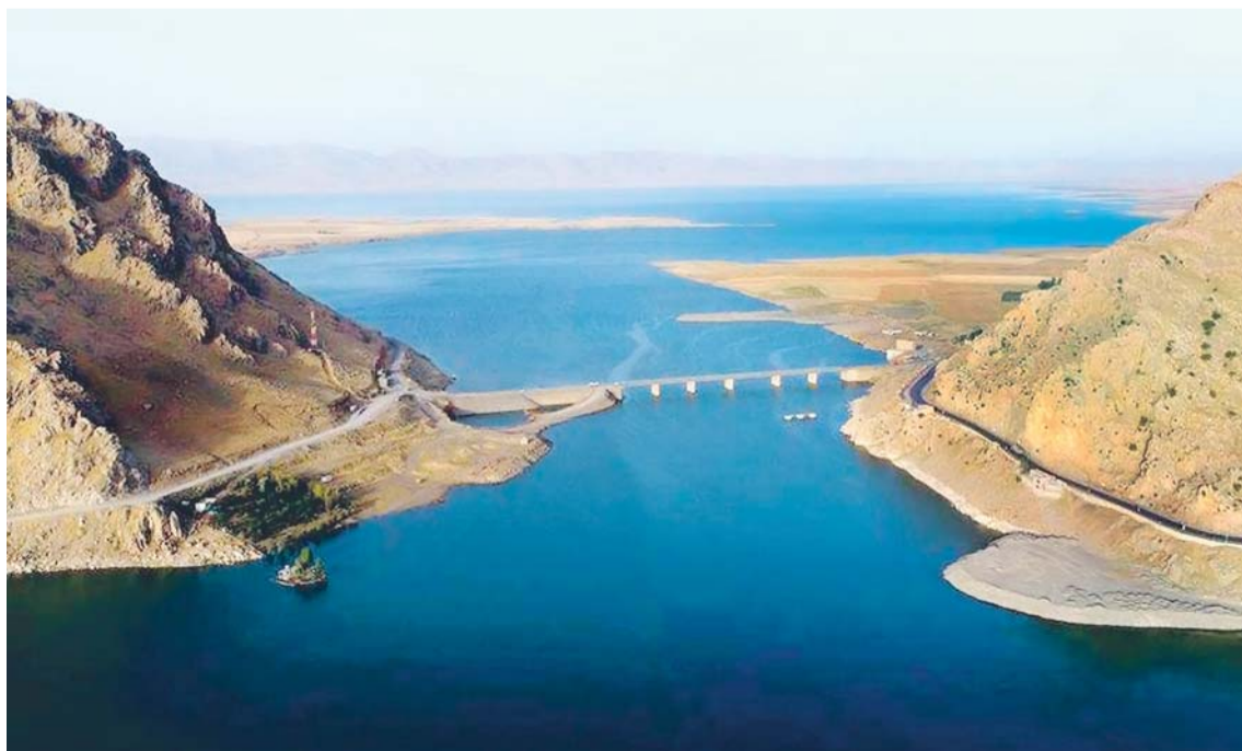
LA CIUDAD FUNDADA POR ALEJANDRO MAGNO QUE DESAPARECIÓ 2.000 AÑOS. UNA FOTOGRAFÍA TOMADA CON UN SATÉLITE DE LOS ESTADOS UNIDOS EN LA DÉCADA DE 1960 FUE EL PUNTO DE PARTIDA.

La antigua ciudad de Qalatga Darband, que supuestamente fue fundada por Alejandro Magno (356-323 a.C.), ha sido descubierta después de haber estado perdida en el Kurdistán iraní durante más de 2.000 años. El emplazamiento, que domina un río en la provincia de Sulaimaniya, muestra las huellas de un antiguo asentamiento fortificado.