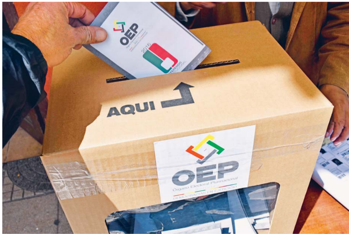
ORGANIZACIONES NACIONALES E INTERNACIONALES PIDIERON AL GOBIERNO RESPETE EL RESULTADO DEL REFERENDO DEL 21 DE FEBRERO DEL 2016, DONDE EL 51.34 POR CIENTO DE LA POBLACIÓN DIJO "NO" A UNA TERCERA ELECCIÓN CONSECUTIVA DE EVO MORALES.