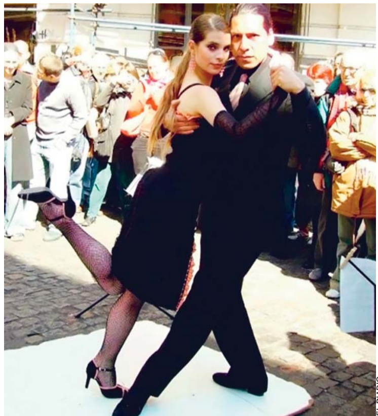
ARGENTINA, URUGUAY Y BOLIVIA EN COMPETENCIA EN FESTIVAL DE TANGO.