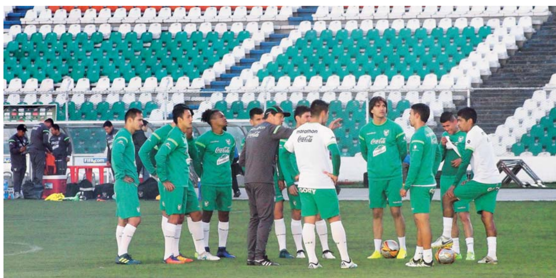
LA VERDE TIENE PREVISTO EL PARTIDO CON LA SELECCIÓN DE BRASIL EL 5 DE OCTUBRE EN LA PAZ Y EL 10 CON URUGUAY EN MONTEVIDEO.