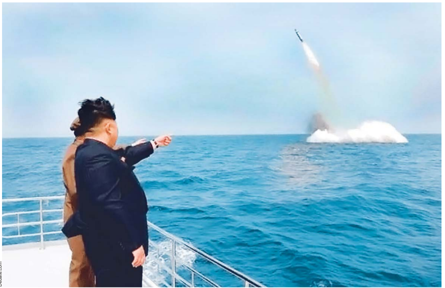
LOS TEMBLORES SON A CAUSA, PRESUNTAMENTE, A LA EXPLOSIÓN NUCLEAR DEL PASADO 3 DE SEPTIEMBRE QUE DEBILITÓ LA ESTRUCTURA DE LAS PLACAS TECTÓNICAS. KIM JONG-UN ANUNCIÓ MAS EJERCICIOS MILITARES.

El terremoto del 7 de septiembre ha tenido un total de 7.591 réplicas, las dos mayores de magnitud 6,1 hasta el momento, y el ocurrido el 19 de septiembre ha registrado 39, la más fuerte de magnitud 4, informó el Sismológico. (EFE)