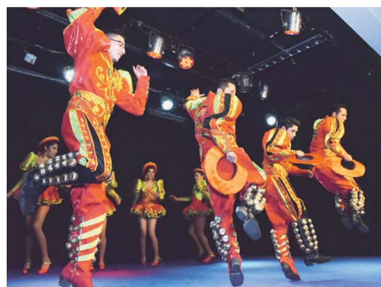
COMENZARON LOS PREPARATIVOS DEL CARNAVAL DE OROURO 2018.