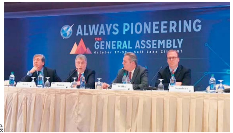
EJECUTIVOS DE SIP DURANTE LA 73ª ASAMBLEA GENERAL EN SALT LAKE CITY (EEUU).