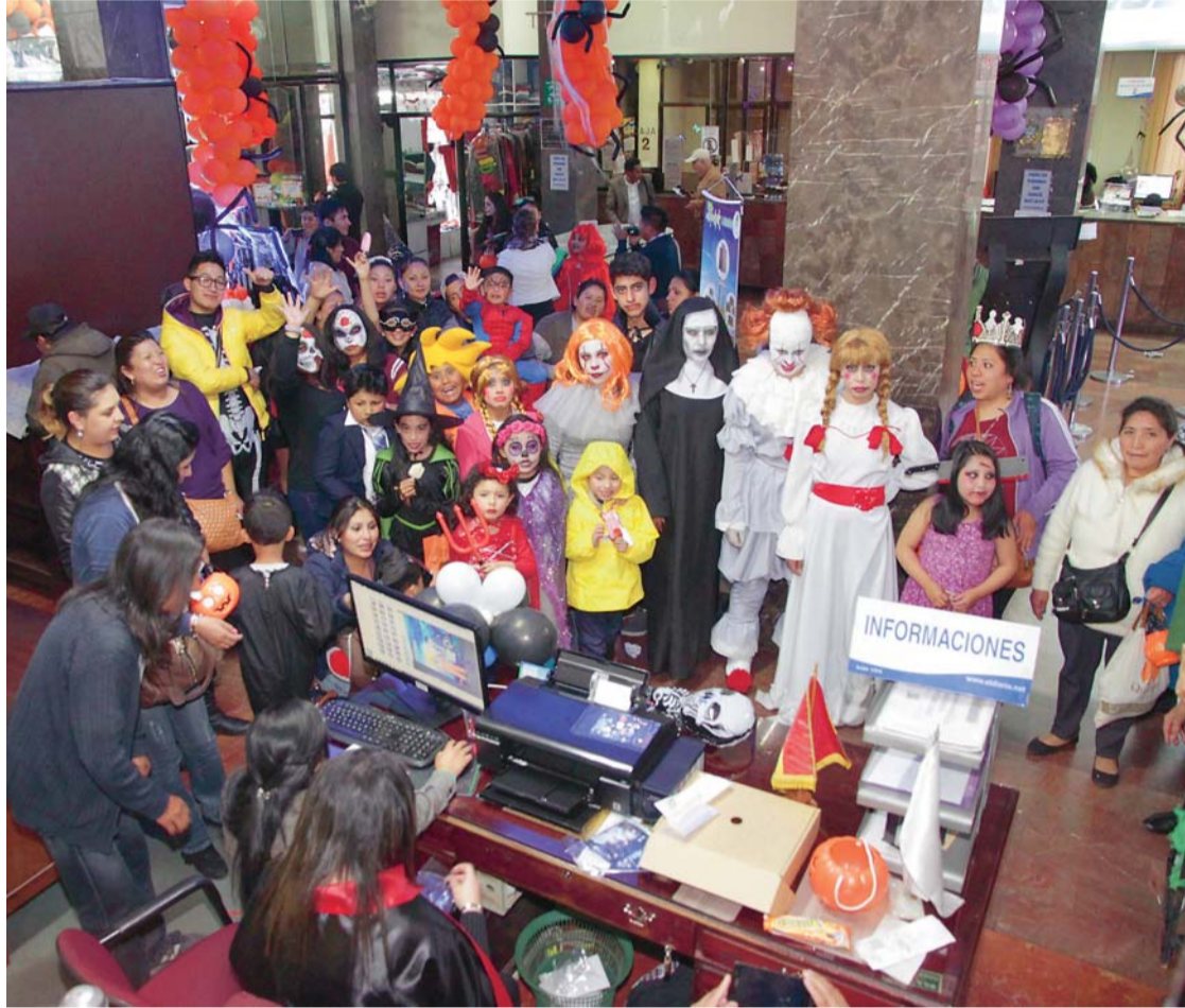
VARIOS MOMENTOS, LOS MEJORES QUE VIVIERON CIENTOS DE PERSONAS QUE AYER VISITARON EL DIARIO.

EL DIARIO , Decano de Prensa Nacional, una vez más, ratificó ayer su liderazgo, no solamente como el periódico más confiable e independiente del país, sino también como un excelente organizador de eventos para la sana diversión de la familia boliviana.