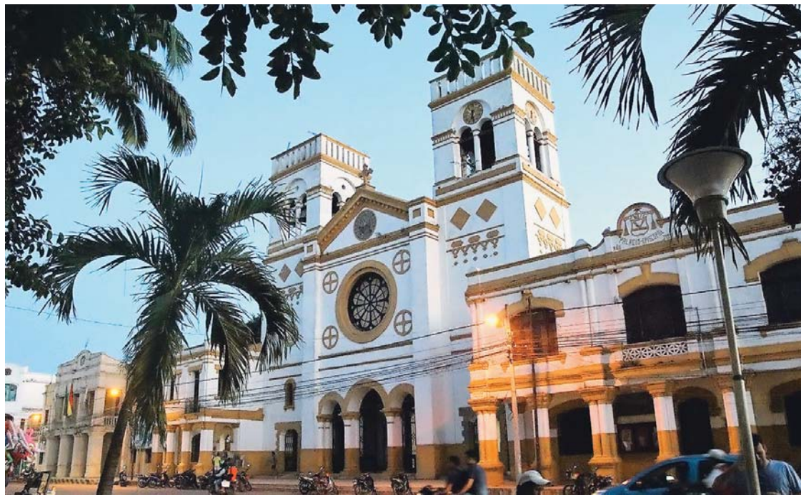
LA POBLACIÓN BENIANA ESTÁ DE FIESTA.