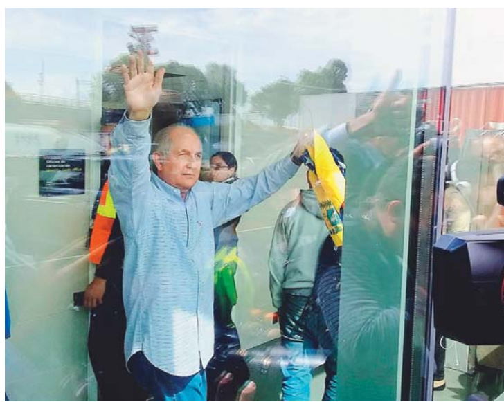
EL ALCALDE OPOSITOR VENEZOLANO ANTONIO LEDEZMA SALUDA A LOS PERIODISTAS EN EL AEROPUERTO EL DORADO EN BOGOTÁ.