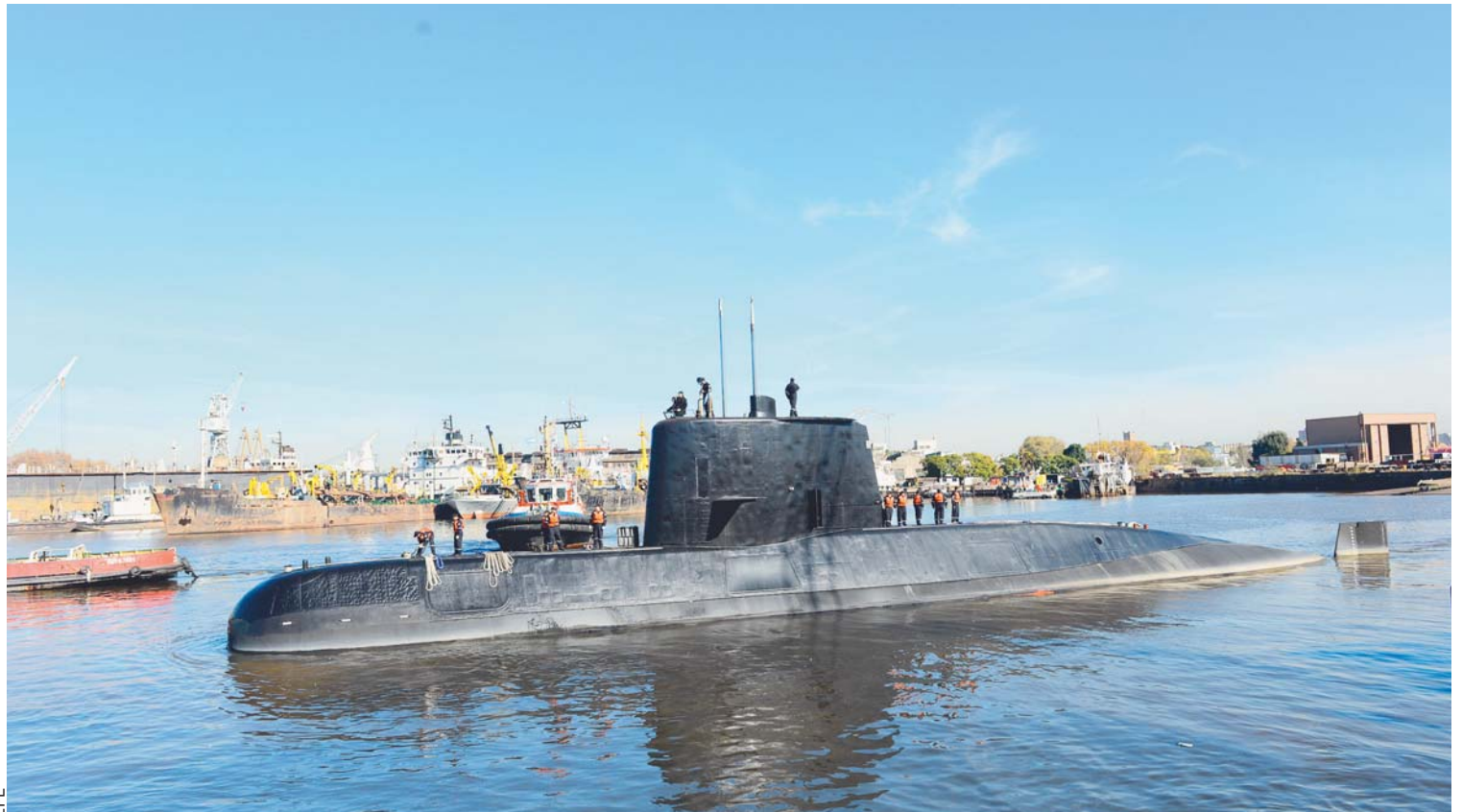
AERONAVES Y BUQUES DE ARGENTINA BUSCAN UN SUBMARINO DE LA ARMADA, CON EL QUE SE PERDIÓ EL CONTACTO HACE 48 HORAS, INFORMARON FUENTES DEL CUERPO NAVAL.