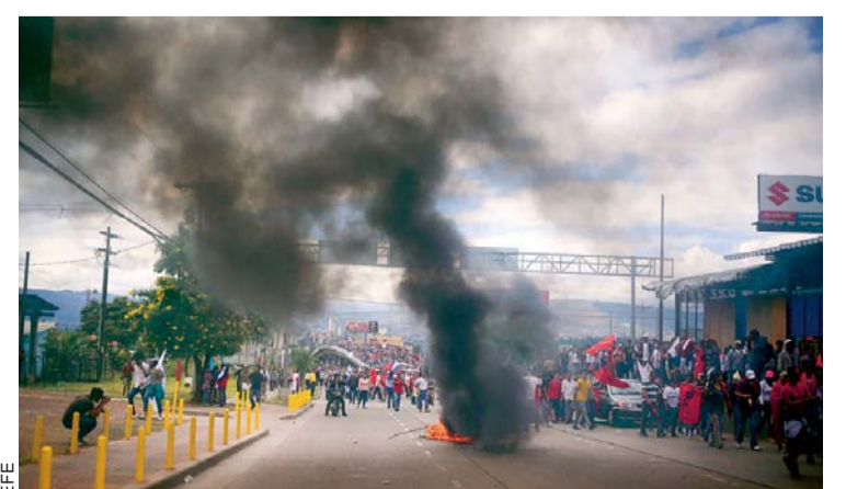
DISTURBIOS EN HONDURAS COMO PROTESTA DE REELECCIÓN DE HERNÁNDEZ, DESPUÉS DE CUESTIONADOS COMICIOS.