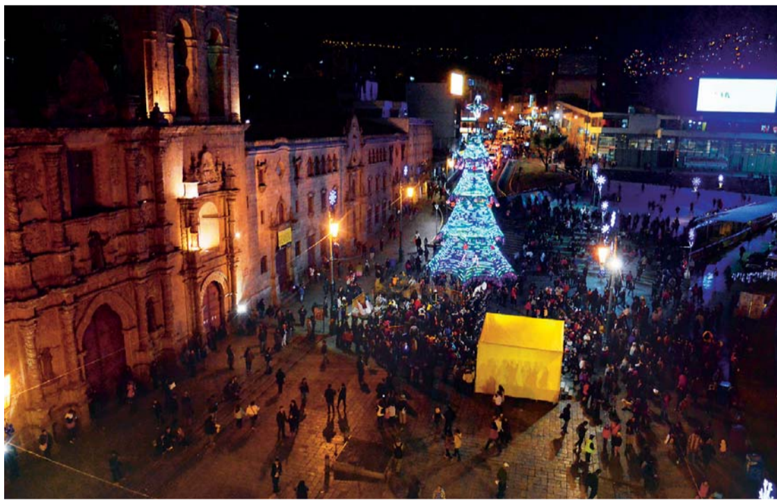
Desde anoche, la Navidad ilumina La Paz

Anoche fueron encendidas las luces de los dos árboles ecológicos armados en La Paz, uno en la plaza Mayor de San Francisco y otro en el frontis del Palacio Consistorial.