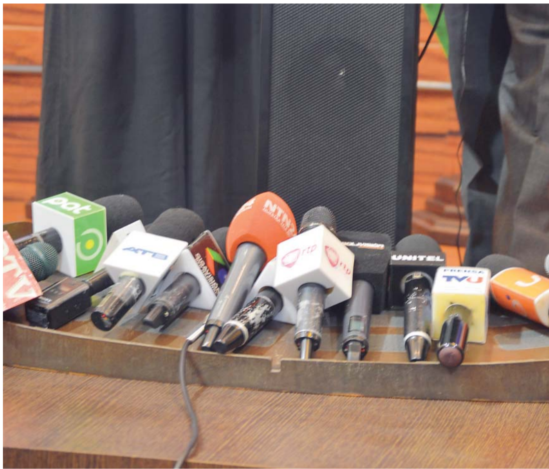
PERIODISTAS EN ESTADO DE ALERTA PARA DEFENDER LA LIBERTAD DE EXPRESIÓN EN BOLIVIA.

Alude también a un "comportamiento antiético" en las investigaciones de prensa, "atropello de la privacidad, mal manejo de las fuentes, plagio,