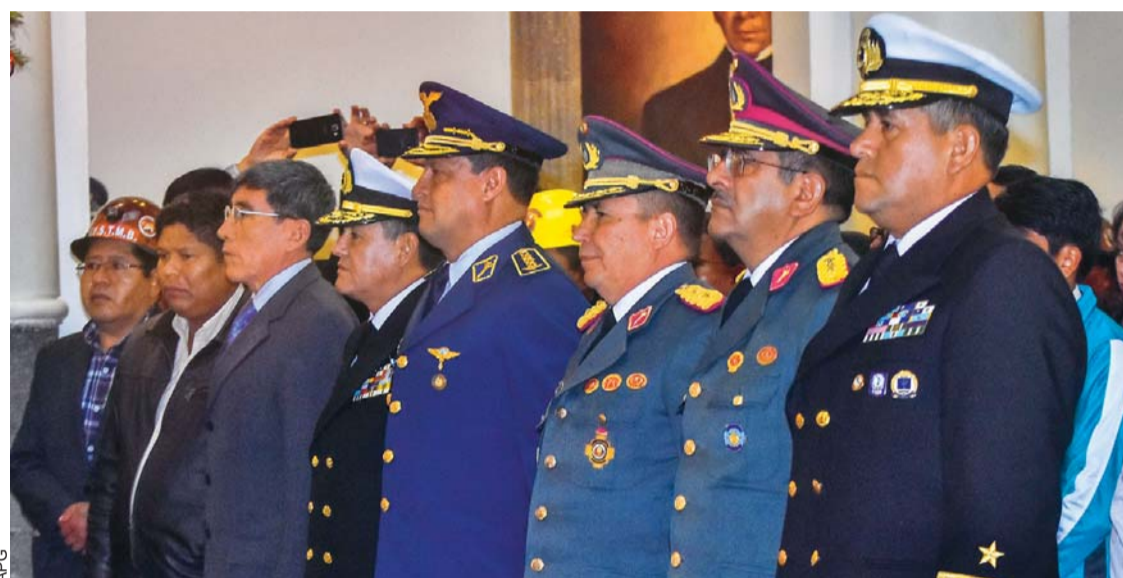
POSESIÓN DEL ALTO MANDO MILITAR.

Varios medios chilenos se hicieron eco de las palabras del Presidente, por ejemplo: El Mercurio, Soy Chile, Ahora Noticias, 24horas y La Tercera.