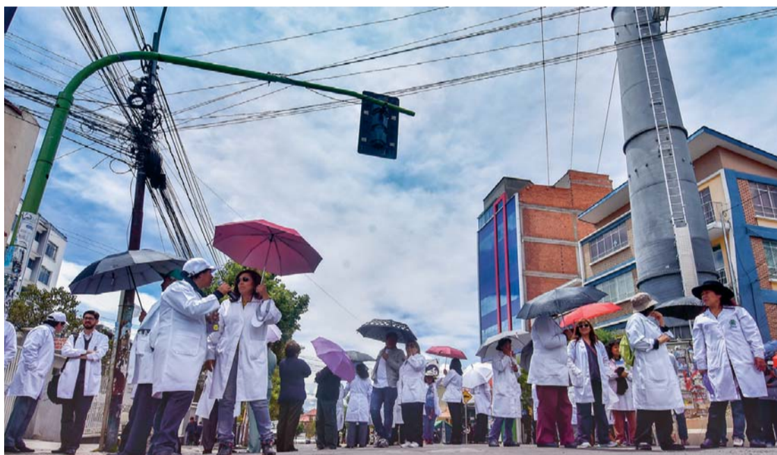
BLOQUEO DE MANDILES BLANCOS A DOS SEMANAS DE MOVILIZACIONES.