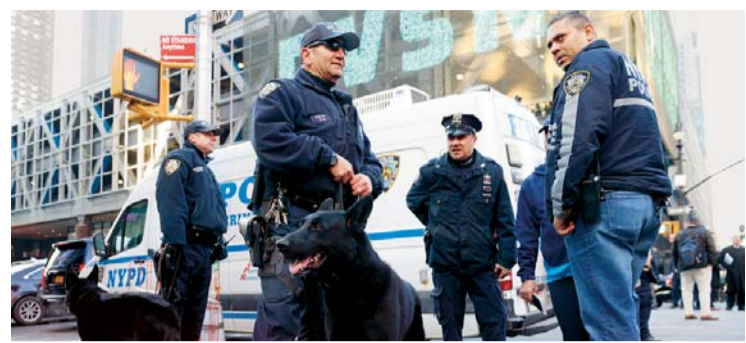
GUARDIAS REALIZAN CERCO EN EL LUGAR DEL ATENTADO, LUEGO DE LA EXPLOSIÓN QUE CAUSÓ 5 HERIDOS.

FFAA deben "planificar escenario post demanda marítima"