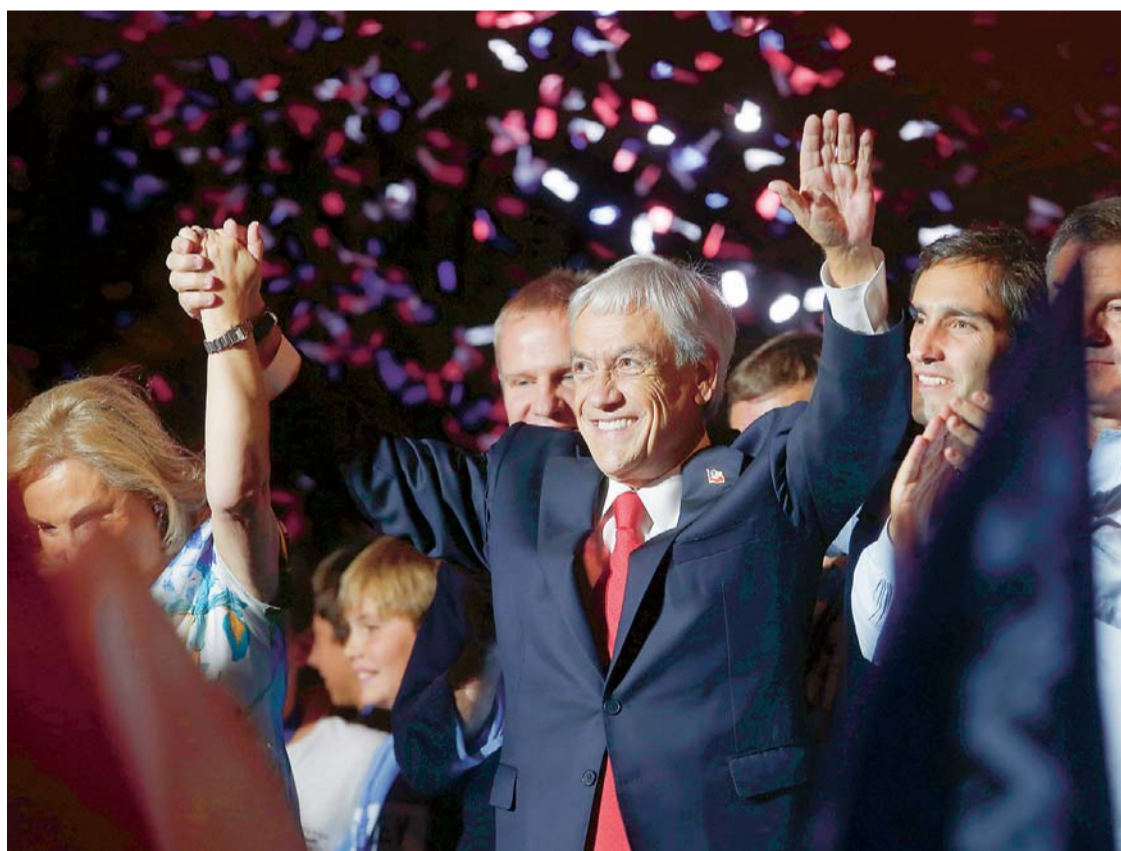
PIÑERA ANUNCIA QUE PROPONDRÁ GRANDES ACUERDOS PARA SER "PRESIDENTE DE TODOS"

• Ya gobernó el hermano país entre 2010-2014 y durante su gestión, Bolivia y Chile atravesaron el momento más crítico en sus relaciones debido al diferendo marítimo