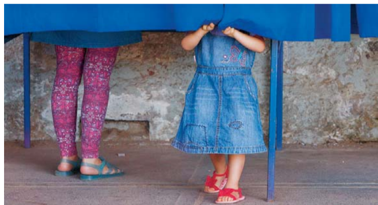
Imagen que dio la vuelta al mundo: Voto secreto

UNA MUJER ACOMPAÑADA DE UNA NIÑA VOTA DURANTE LA JORNADA DE ELECCIONES PRESIDENCIALES DE AYER DOMINGO 17 DE DICIEMBRE DE 2017, EN EL ESTADIO NACIONAL DE SANTIAGO (CHILE). LA SEGUNDA VUELTA DE LA ELECCIÓN PRESIDENCIAL EN CHILE COMENZÓ CON LA APERTURA DE LOS COLEGIOS, EN LOS QUE UNOS 14,3 MILLONES DE VOTANTES FUERON CONVOCADOS PARA ELEGIR ENTRE EL CONSERVADOR SEBASTIÁN PIÑERA Y EL PROGRESISTA ALEJANDRO GUILLIER. A FINAL DE LA TARDE SE SUPO QUE GANÓ EL PRIMERO.